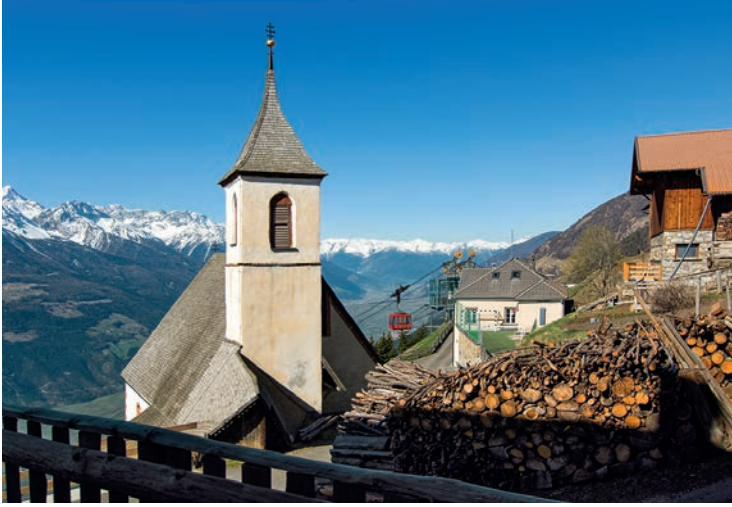
Vom Kirchlein aus erreicht man entlang idyllischer Wege einige der ältesten und höchstgelegenen Bergbauernhöfe des Tales.

zwangsweise in Süd-Nord-Richtung ausgerichtet, hat aber gegen Osten hin ein Fenster, durch das am 11. November, also genau zu Martini, ein Sonnenstrahl direkt auf den Altar fällt. Es handelt sich also um eines jener astronomisch ausgerichteten Gotteshäuser, deren sakrale Architektur seit jeher präzisen Orientierungsregeln folgt, die sich vor allem auf die Sonne und die Himmelsrichtungen beziehen, um die Bedeutung des Symbolhaften am Bauwerk hervorzuheben, seien es nun ägyptische Pyramiden, hochstrebende äthiopische Obelisken, mächtige etruskische und skythische Grabhügel oder sardische Megalithgräber und mittelalterliche Kirchen. All diese hatten einen gemeinsamen Nenner: die erhabene Bedeutung der Sonne selbst und ihrer Strahlen. Die mittelalterlichen Baumeister bezeugten auch damit ihr profundes Wissen über die Geschehnisse am Himmel, das sie in den Bau einfließen lassen konnten. Die Kirche ist damit also nicht mehr nur ein Hort des Glaubens, sondern teilt sich uns auch in einer Symbolsprache mit, durch die der Erbauer das Wesen des Ortes zu einer Einheit von Zeit und Raum verdichtet.