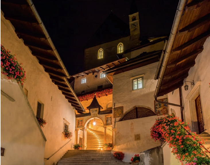
Sankt Romedius im Nonstal. Unten in der Krypta, am Grab des Heiligen, fühlte man sich dem Himmel näher.