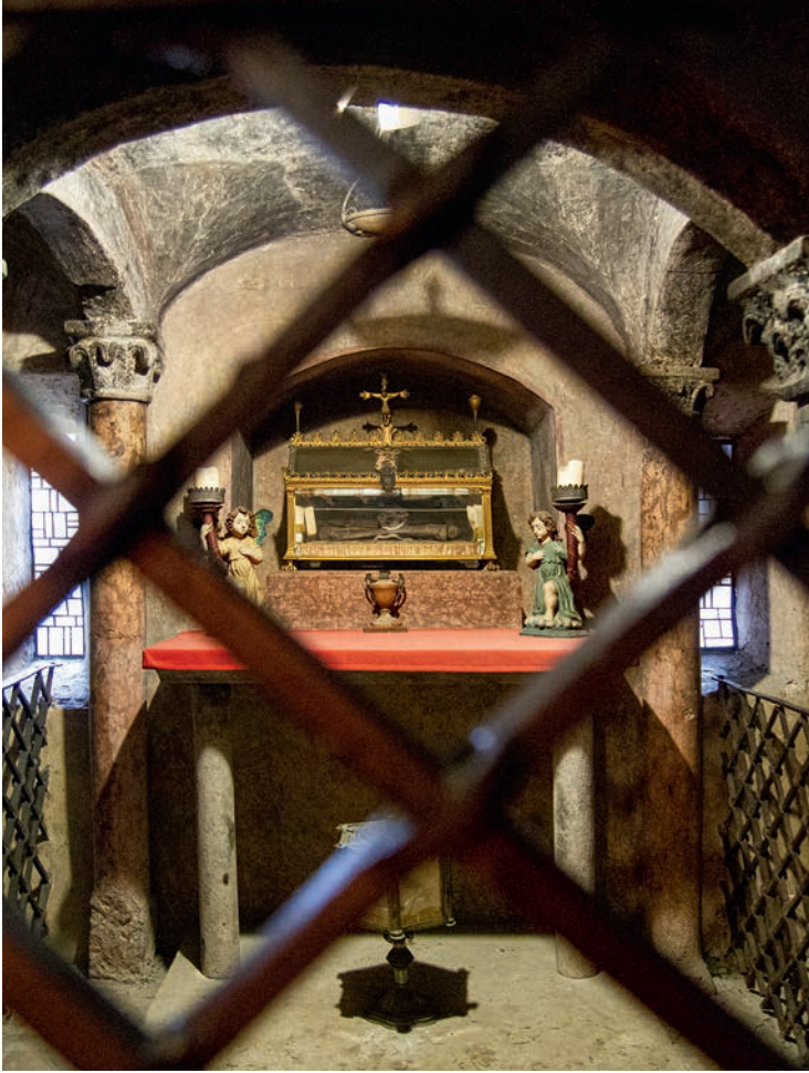
Das Sancta Sanctorum , das pulsierende Herz der Pilgerstatt: der Reliquienschrein.

seinen Namen erhielt. Mit seiner Niederlassung an diesem abgelegenen, unwegsamen, der wilden Natur überlassenen Ort vereinte Romedius, noch weit vor dem Wirken von Feldherren und Volkshelden, das Land der Berge nördlich und südlich des schicksalsschweren Brennerpasses und nahm damit geistig die meinhardinische Gründung der Grafschaft Tirol um Jahrhunderte vorweg.