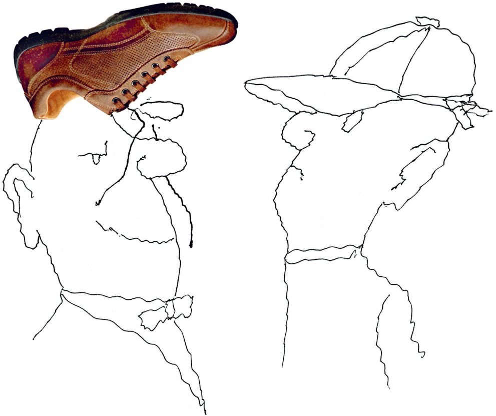
Der Schuhfreund aus der Schule