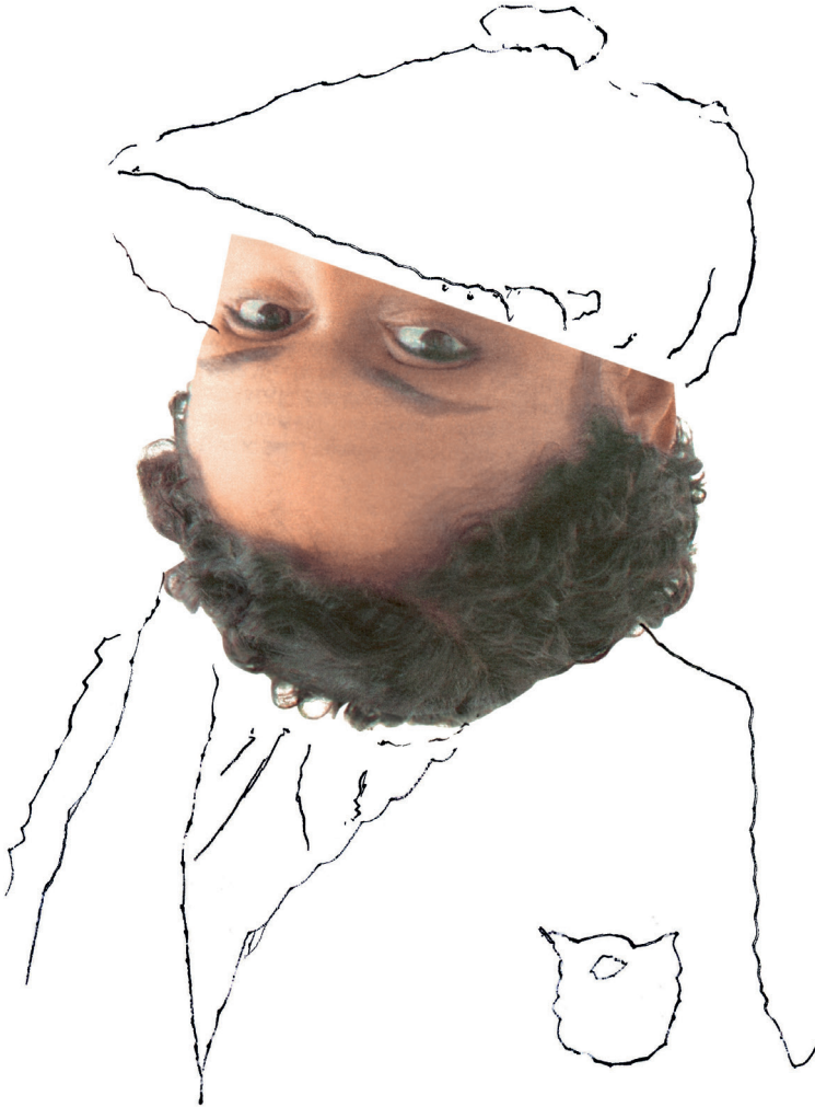
Geheimer Künstler am Montparnasse