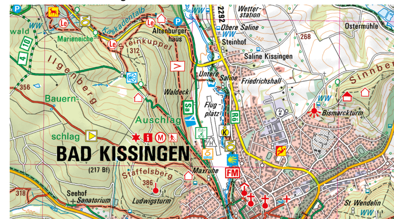
Ausschnitt aus UK50-1 Naturpark Bayerische Rhön

Wer mit der Familie das Freilandmuseum Fladungen besucht kann dies mit einer Fahrt im historischen Rhönzüge verbinden. Erholung und Ruhe hat man beim Kuren in einem der berühmten Bäder der Rhön wie der KissSalis Therme in Bad Kissingen und dem Kurhaus Bad Bocklet.