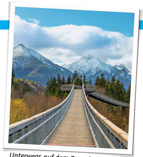
Unterwegs auf dem Baumkronenweg

Aggenstein bis zum Tegelberg, mit nur einem Schritt überquert man in der Mitte des Weges sogar die Grenze zwischen Bayern und Tirol ( www.wald-erlebniszentrum.eu ).