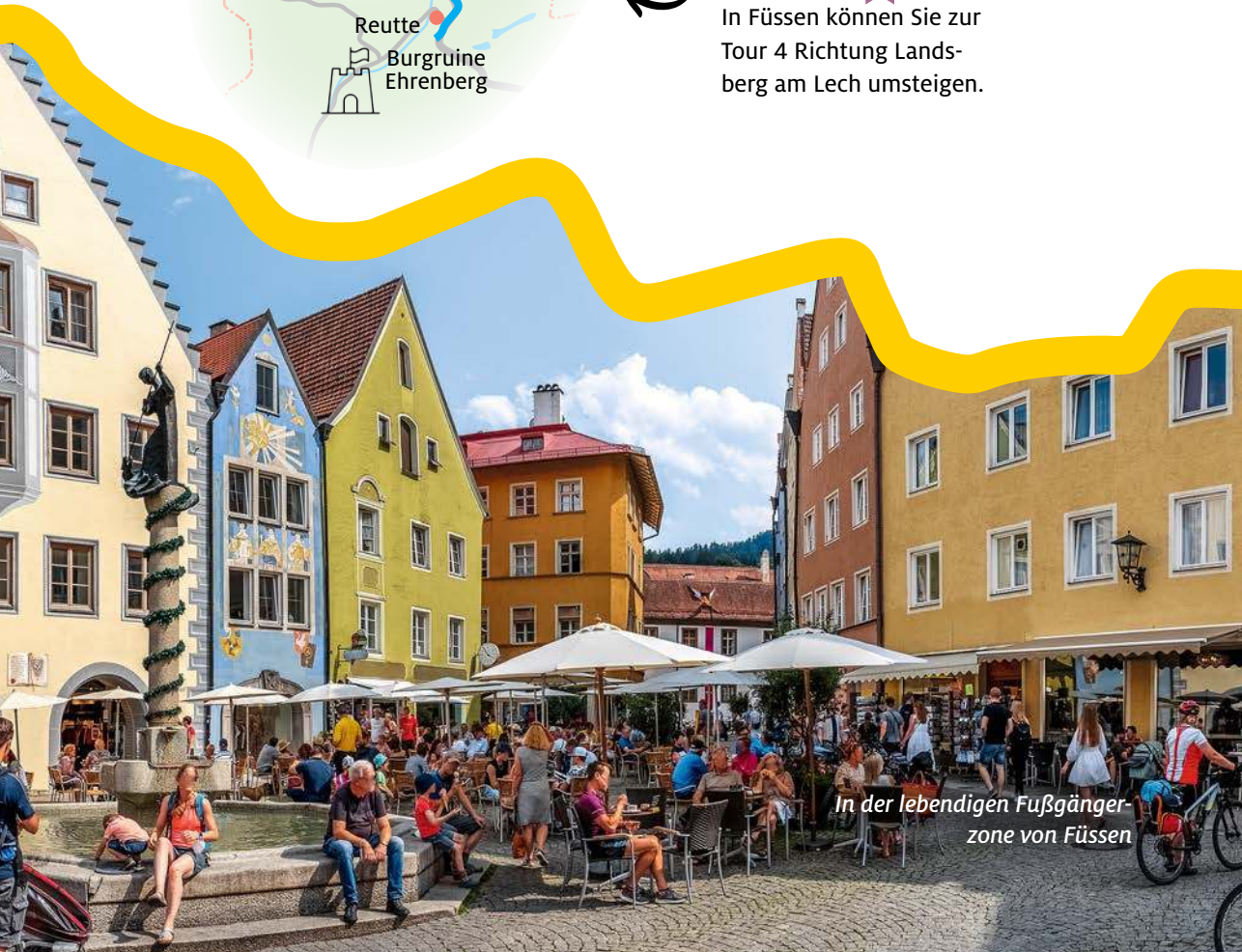
In der lebendigen Fußgängerzone von Füssen

In Füssen können Sie zur Tour 4 Richtung Landsberg am Lech umsteigen.