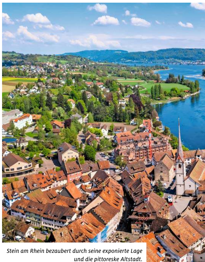
Stein am Rhein bezaubert durch seine exponierte Lage und die pittoreske Altstadt.