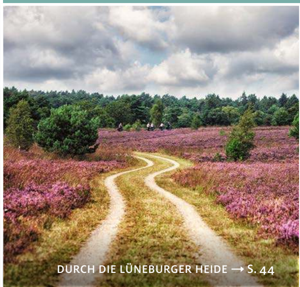
DURCH DIE LÜNEBURGER HEIDE → S. 44