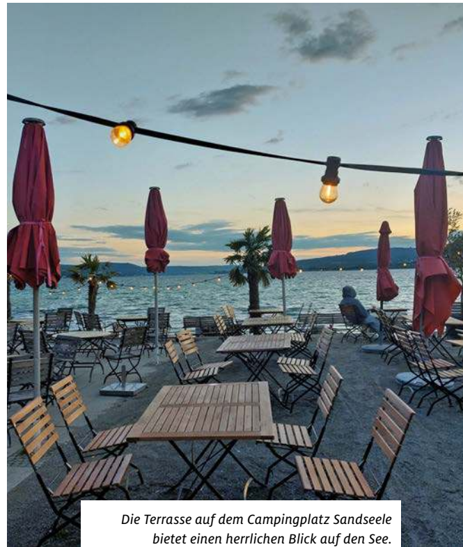
Die Terrasse auf dem Campingplatz Sandseele bietet einen herrlichen Blick auf den See.

Nach Verlassen des Campingplatzes links Richtung Niederzell und dann auf dem nördlichen Uferweg bis zur Allee fahren. Auf dem Festland die B 33 überqueren und kurz vor den Bahngleisen der Beschilderung nach Konstanz folgen. Kurz vor Konstanz auf der Brücke über die Bodenseeenge in den mittelalterlichen Stadtteil Niederburg mit Münster und Rosengarten sowie auf einen Abstecher in die Altstadt. Das Rad an einem Fahrradständer abstellen und durch die hübschen Gassen bummeln, vorbei am mit Fresken geschmückten Rathaus bis zum relativ großen Hafen. Zu gemütlich sollte man es aber nicht angehen, denn es warten noch rund 80 Kilometer! Zurück auf dem Rad geht es über die offene Grenze in die Schweiz und durch das Tägermoos, die hübsche Ortschaft Gottlieben bis nach Stad mit seiner schönen Uferpromenade. Die Strecke ist gut ausgeschildert und verläuft überwiegend auf Radwegen oder Nebenstraßen. Das gesamte Westufer fährt man auf