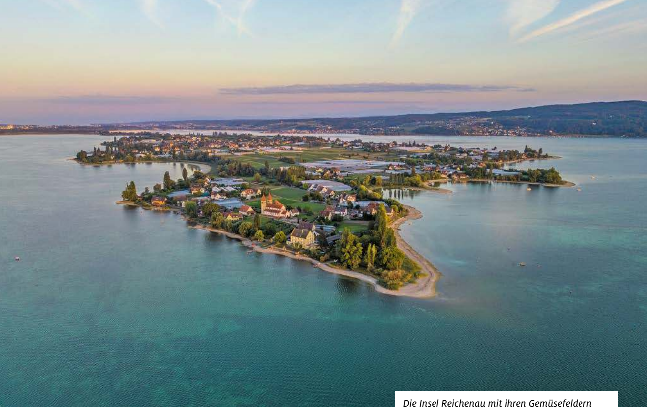
Die Insel Reichenau mit ihren Gemüsegeldern gehört zum UNESCO-Weltkulturerbe.