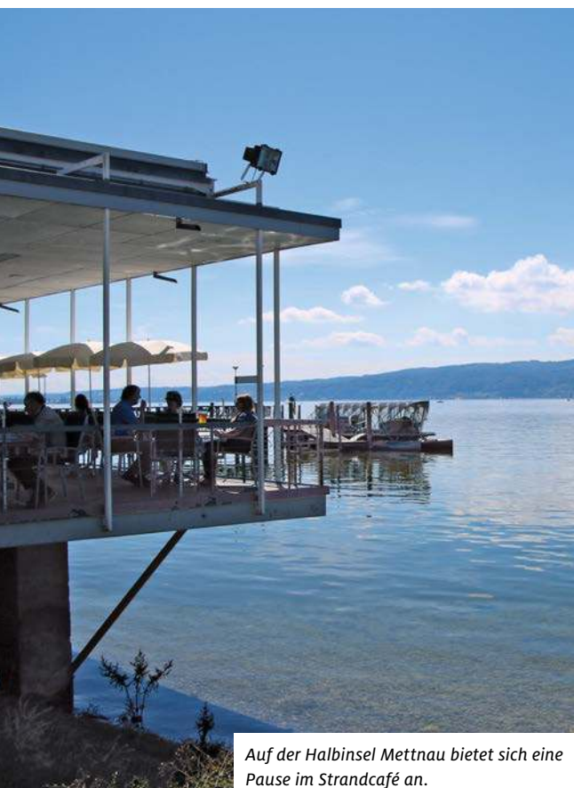
Auf der Halbinsel Mettnau bietet sich eine Pause im Strandcafé an.

abzweigen. Hier stößt man schon auf die ersten Hinweisschilder Richtung Mindelsee. Es geht jetzt einige Anstiege hinauf. Am Roßberg vorbei durch Wälder und Wiesen erreicht man bei Kilometer 20 den höchsten Punkt der Tour. Schon bald gibt es die ersten Aussichten auf den Mindelsee, der völlig naturbelassen ist. Über Dürrenhof wird der See umrundet. Durch Sumpfgebiete, wie das Mögginger Ried, kommt man zum Waldfriedhof Markelfingen. Ein Pfad führt am schattigen Seeufer entlang bis zum südlichen Ende. Hier rechts halten und wieder einen längeren Anstieg hinauf, über die B 33 und dann hinunter nach Markelfingen sausen. Hier führt die Tour nun rechts der