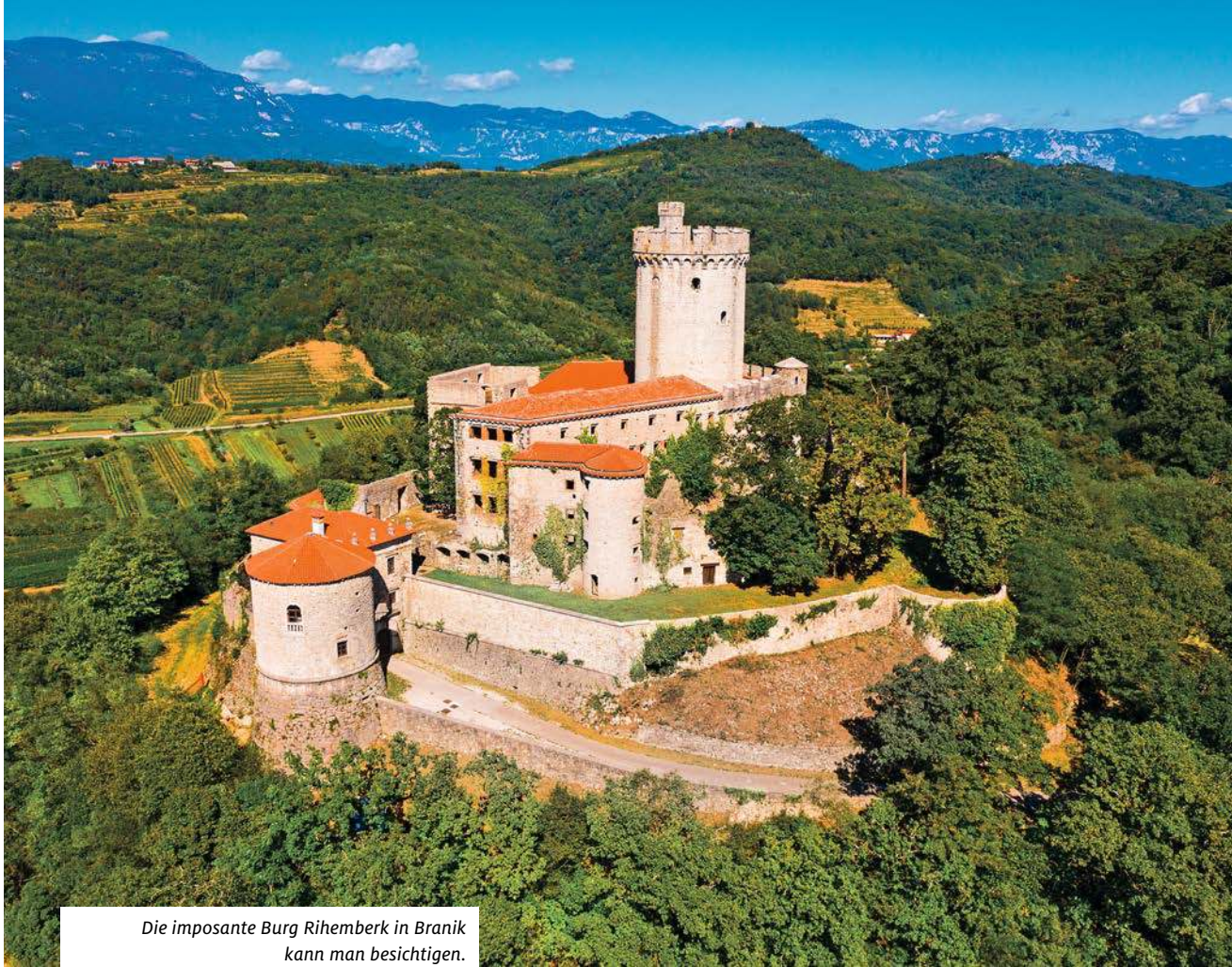
Die imposante Burg Rihemberk in Branik kann man besichtigen.

Karstes an die Oberfläche dringt. Anschließend geht es über einige Serpentina bergab ins Tal der Branica, einem Zufluss der Vipava, und den Bach entlang zurück zum Camp. Die Betreiber können mit Kartenmaterial bei der Planung helfen und haben zudem diese Route digital markiert.