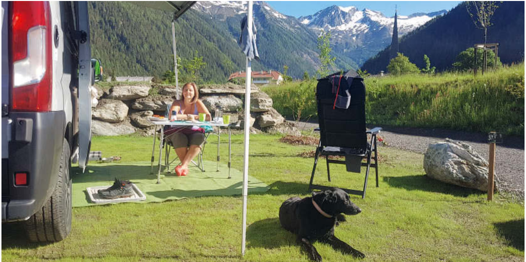
Frühstück mit Blick auf die Berge – Hund »Coffee« ist immer dabei.