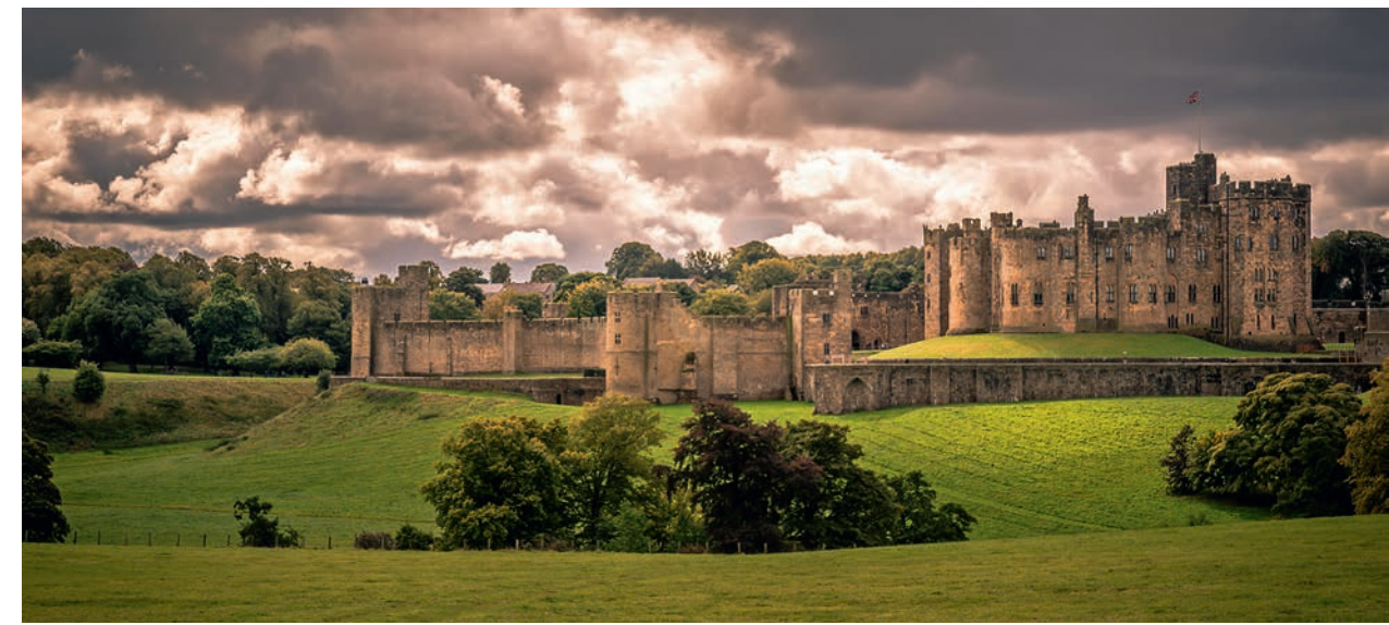
DAS SCHLOSS IST UMGEBEN VON RASENFLÄCHEN und malerisch angelegten Baumgruppen in einem Parkgelände.