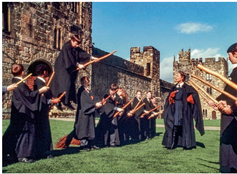
IN ALNWICK GARDEN lernte Harry Potter fliegen.