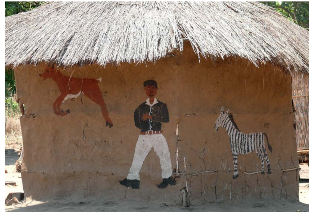
Bemalte Hütte auf der Talabfahrt von Lundazi

Als Rückzugsgebiet während der Regenzeit, wenn die Bäche und Flüsse in diesem hügeligen Gelände Wasser führen, ist der Nationalpark auch für umherziehende Wildtiere wie Elefanten und Büffel bedeutend; die unkontrollierte Wilderei gibt dennoch wenig Anlass zu Hoffnungen auf gesunde Tierbestände.