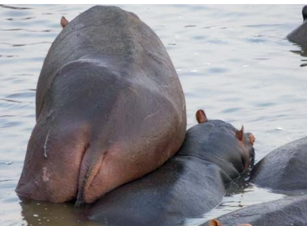
Je später die Saison, umso enger wird es in der Flusspferdherde, denn alle wollen ins tiefere Wasser. Rüpeleien und Aggressionen sind dann an der Tagesordnung