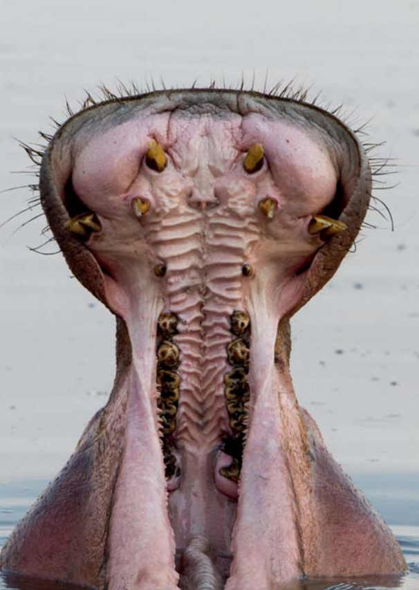
„Gähnen“ ist ein Dominanzverhalten