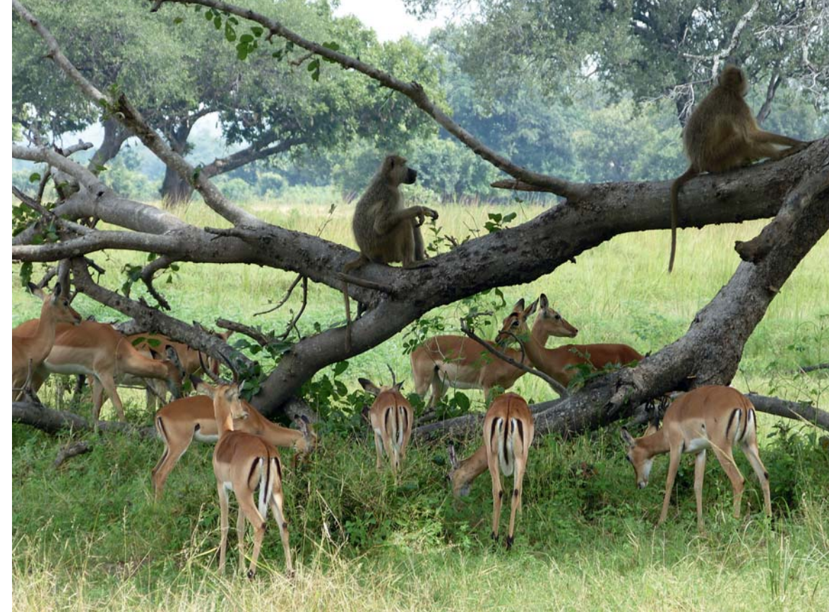
Paviane halten sich gern in der Nähe von Impalas auf Sanitärbereich des Campingplatzes

2015 fand sich endlich wieder ein ambitionierter Betreiber, der den idyllischen Park erneut aufblühen lassen möchte. Der Campingplatz ist seither wieder geöffnet, und in naher Zukunft sollen vier Zeltchalets hinzukommen sowie einige Pirschwege entlang der lieblichen Uferszenerie und zu nahe gelegenen Lagunen angelegt werden. Bislang bietet sich nur der Chipuka Drive für Pirschfahrten an, aber es ist ohnehin spannender, im Camp dem Gezänk der dicht im seichten Luangwa gedrängten Flusspferde zu lauschen.