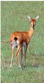
Unten: Oribi, Kaffertrappe