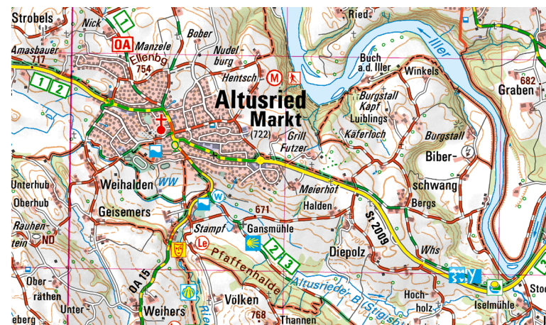
Ausschnitt aus UK50-46 Kempten (Allgäu)

Erfrischungen für Radler und Wanderer bieten Badeseen wie der Rottachsee, Grüntensee, Großer Alpsee und Niedersonthofener See. Den ultimativen Freizeitspaß hat man bei der schnellsten Zipline Deutschlands, der AlpspitzKick bei Nesselwang. Einen entspannten Ausflug machen Familien in die Schmetterling Erlebniswelt bei Pfronten.