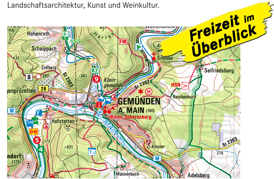
Ausschnitt aus ATK100-1 Spessart

Attraktive Freizeitziele sind die Grube Wilhelmine in Sommerkahl und der Kisspark in Bad Kissingen. Die „terroir f“ erlauben wunderbare Aussichten auf die Fränkische Weinlandschaft und informieren zu den Themen Landschaftsarchitektur, Kunst und Weinkultur.