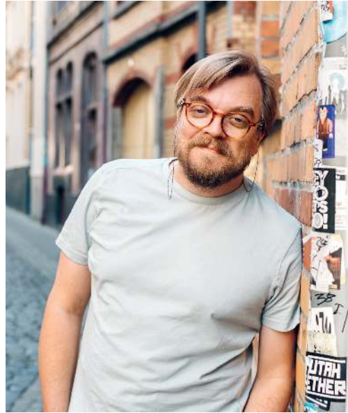
Köln hat mich geprägt wie keine andere Stadt.

denn beim Pitter ist sowieso immer irgendwer, den man kennt. Und so ist Köln durchzogen von magischen Orten. Von potenziellen Treffpunkten. Und an jedem Ort weiß man ungefähr, wen man dort sieht. Es gibt Clubs, in denen man nur Sportstudenten trifft, Bars, in denen nur ehemalige Musikredakteure am Tresen hängen, und Imbisse, an denen nur Taxifahrer essen. Und mittendrin steht man dann und überlegt, worauf man heute Lust hat: kölsche Lieder oder kölsche Leader. Das Beste aber ist: Egal wie man sich entscheidet, man wird Einzigartiges erleben. Man wird Herzliches erleben. Und wie sehr man sich auch dagegen wehrt, man wird schnell feststellen: Die Welt wäre ein schönerer Ort, wenn alle Menschen Kölner:innen wären.