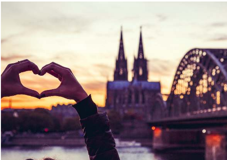
Wer in der Dämmerung am Fuß der Hohenzollernbrücke steht, dem springt der Kölner Dom ins Auge – man kann da nur ein Herz formen.