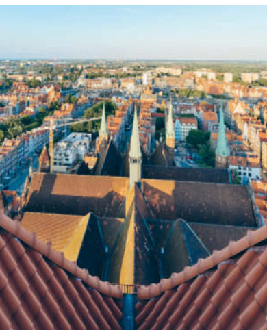
Blick von der Danziger Marienkirche

6 Grenzenloses Bikevergnügen Auf der Radtour, die von Świnoujście > S. 58 12 km zu den deutschen Kaiserbädern, über Ahlbeck und Heringsdorf bis Bansin führt, geht's immer parallel zur Uferpromenade (Radverleih: Usedom Rad, Bahnhof, Wojska Polskiego, www.usedomrad.de , ab 9 €/Tag; Rückfahrt mit DB-Regio Kaiserbad-Europa-Linie, www.ubb-online.com , 3 €/Pers. und 6 €/Rad).