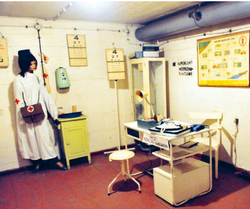
Eine ganze Stadt im Untergrund – inklusive ärztlicher Versorgung