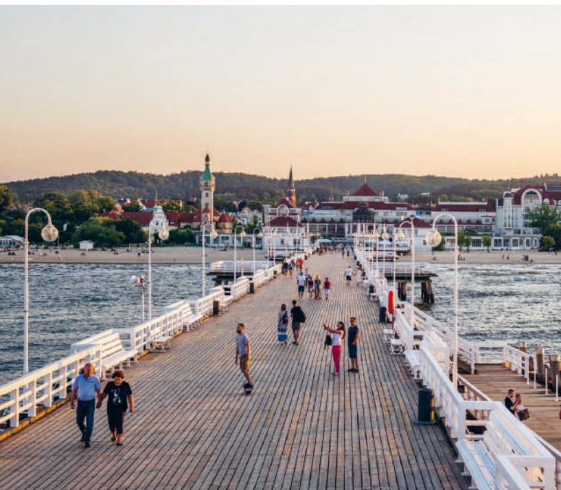
Sopots lange Mole, Treffpunkt für Einheimische und Urlauber

Ein heller Gürtel feinen Sandstrands zieht sich über 500 km von der deutsch-polnischen Grenze auf der Insel Usedom Richtung Osten; landeinwärts liegen Seenplatten, von denen die masurische die schönste ist.