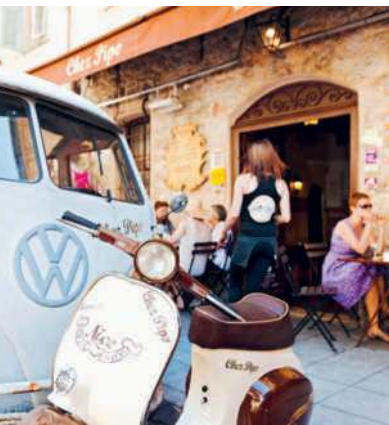
Laissier-aller in der Altstadt von Nizza – den Dingen einfach mal ihren Lauf lassen

von milden Wintertemperaturen verzaubern. Viele Maler erwählten den Küstenstrich zum Freilichtatelier – ihre Hinterlassenschaften sind in Kunstmuseen, Kirchen und Kapellen zu entdecken. Mittlerweile geben in den mondänen Badeorten nicht mehr Lords und Edelleute den Ton an, sondern der internationale Jetset. Musste die Beschaulichkeit der Côte über die Jahrzehnte auch touristischen Auswüchsen weichen, findet man doch vor allem im Hinterland immer noch wohlthuende Provinzialität, die in über Straßen gespannten Wäscheleinen und nach Käse duftenden Altstadtmärkten zum Ausdruck kommt.