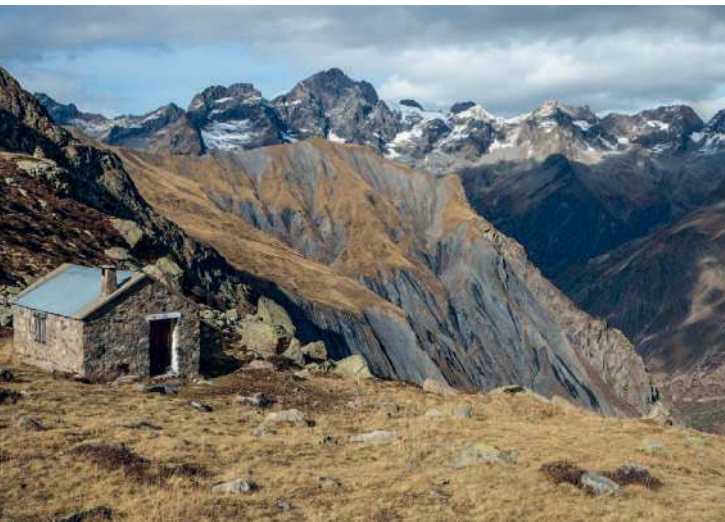
Im Écrins-Nationalpark findet man sie noch, die so oft vermisste Bergeinsamkeit