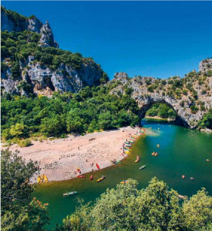
Paddeltour auf der Ardèche – Alternativen zum Nichtstun am Strand gibt es im Überfluss

Auf der Autoroute du Soleil (A 7) nach Südfrankreich reisende Urlauber lernen ihr Zielgebiet häufig zuerst im Rhône-Tal und der Provence kennen. Abseits der Autobahn erstrecken sich sattgrüne Weinberge um noble Schlösschen und verschlafene Landstriche, in denen es im Hochsommer unverkennbar nach Lavendel und wilden Kräutern duftet. Auf Kunstfreunde warten mittelalterliche Dörfer, würdige Zisterzienserabteien und alte Römerstädte; Naturwunder wie die beeindruckende Wasserlandschaft der Camargue und die atemberaubende Ardèche-Schlucht lassen sich zu Fuß, zu Pferd oder mit dem Kanu entdecken. Auf bunten Märkten und in vielen guten Restaurants kann man in den kulinarischen Genüssen schwelgen, welche die sonnenverwöhnte Erde der Region hervorbringt.