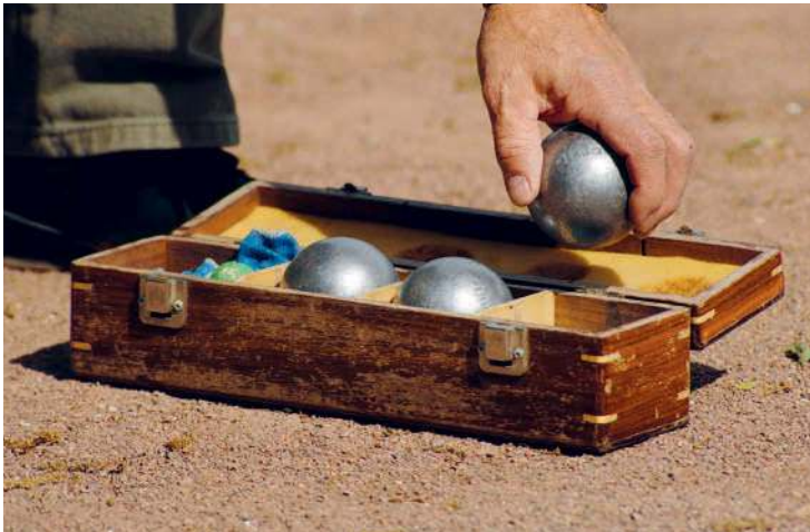
Wo immer sich eine freie sandige Fläche findet, wird in Südfrankreich Pétanque gespielt

13 Banon Chèvre Der in Kastanienblätter gewickelte und mit Bast verschnürte Ziegenkäse ist ein guter Grund für einen Ausflug nach Bannon. Bei der Charcuterie Melchio ■ R8 stapeln sich die Käselaibe und von der Decke baumeln brindilles ,