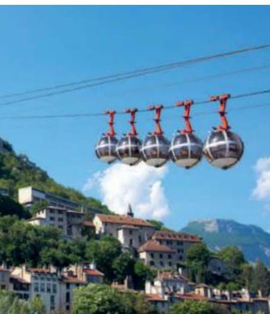
Seilbahn zum Fort de la Bastille in Grenoble