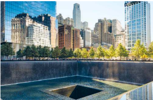
Die Stelle der WTC-Türme nehmen nun die Wasserbecken des 9/11 Memorial ein

> S. 45 gibt es im Süden von Manhattan ein weiteres Discount-Kaufhaus: Lot Less Closeouts ■ c3 (97 Chambers St., www.lot-less.com ) verkauft Auslaufmodelle und Überproduktionen – und das längst nicht nur in Sachen Mode.