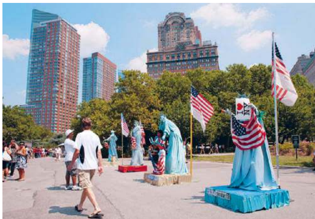
Auf dem Areal des Battery Park gingen die ersten holländischen Siedler an Land