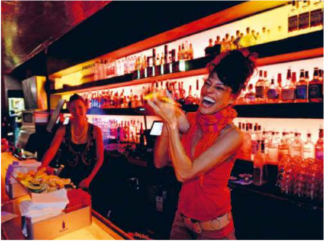
New York hat viele Gesichter und ist dabei alles, nur nicht langweilig

Diva Manhattan verblasst. Von seiner schönsten Seite präsentiert sich der bevölkerungsreichste Stadtteil in Brooklyn Heights mit seinen denkmalgeschützten Brownstone-Häusern.