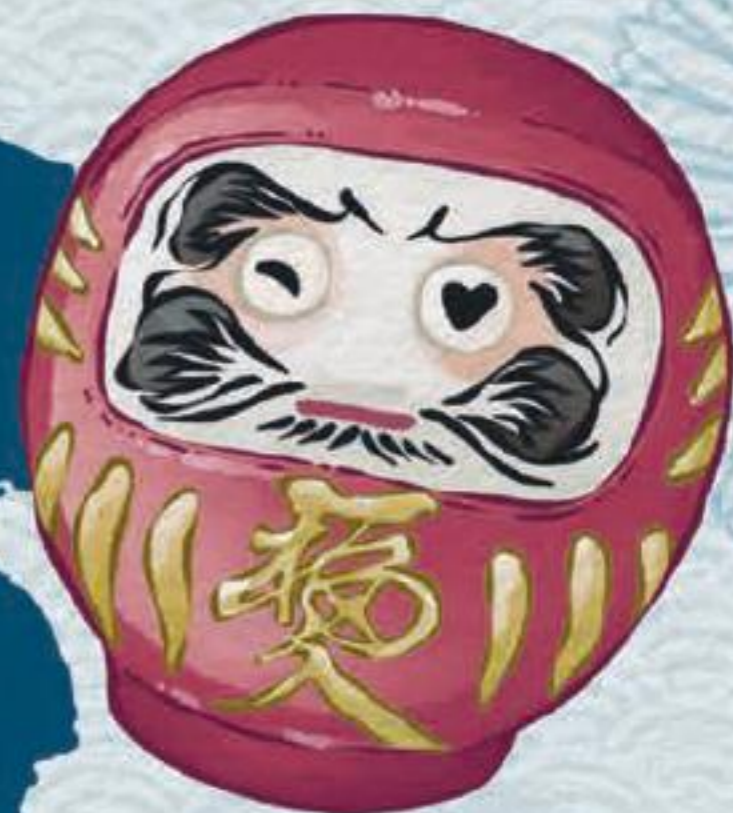
Daruma-Figur – traditionelle japani- sche Figur, die Glück und Selbstdisziplin symbolisiert