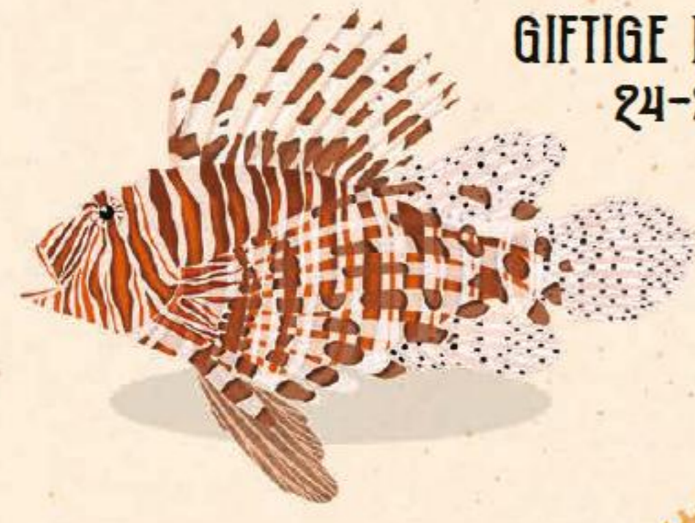
GIFTIGE FISCHE 24-25