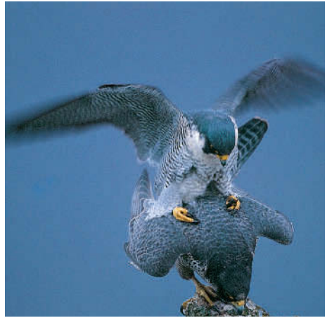
Tretakt (Kopula) eines Wanderfalke-Paars.

belegen. Allerdings legt die bloße Beobachtung einen Zusammenhang nahe: Denn jene Greifvögel, die Mäuse und andere Kleinsäuger jagen, zeigen kaum eine Größendifferenz zwischen den Geschlechtern, wohl aber die Vogeljäger. Insbesondere bedeutet die Verschiedenheit von Körperbau und Lebensweise, dass nebeneinander in einem Lebensraum nicht nur Männchen und Weibchen einer Art verschiedene Beuteangebote nutzen, sondern auch mehrere Arten nebeneinander leben können. Am offensichtlichsten ist dies natürlich bei Arten wie Wespenbussard und Mäusebussard, die sich auf ganz unterschiedliche Beutetiere spezialisiert haben. Aber auch bei der Wahl des Horstbaumes oder der Horstnische kommen sich die Arten nur selten ins Gehege. Die »Wünsche« und Anpassungen der Arten unterscheiden sich auch darin. Und bei Arten, die im selben Lebensraum leben und etwa gleicher Beute nachstellen, gibt es dann – wie zwischen Greifvögeln und Eulen – die zeitliche Entzerrung ihrer Jagdzeiten. Das Nebeneinander verschiedener Arten wird auch erleichtert, indem z.B. bei vielen Arten der Jagdbiotop nicht gleich dem Brutbiotop ist oder indem manche Arten dazu noch eigene Zeitbiotope besitzen, das heißt zu verschiedenen Tages- oder Jahreszeiten wird in unterschiedlichen Lebensräumen gejagt.