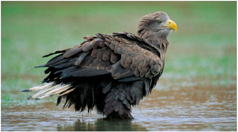
Seeadler nach einem Bad.