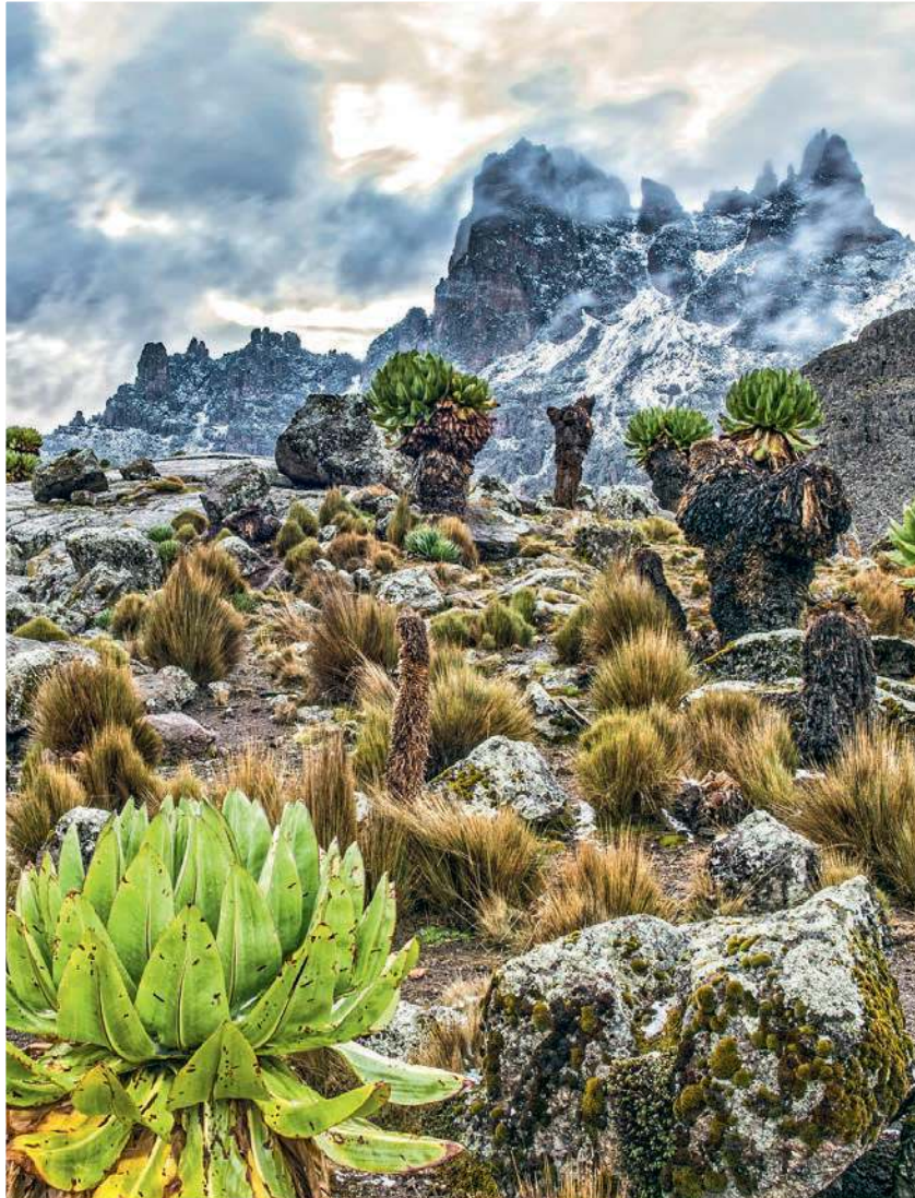
Das Riesenkreuzkraut am Mount Kenya kann zu meterhohen „Bäumen“ heranwachsen

Darüber hinaus locken Tauchgänge vor der Küste Sansibars, Wanderungen im äthiopischen Simien-Gebirge und Radtouren durch den Hell's Gate National Park in Kenia – hier können Sie richtig aktiv sein oder andächtig Wunder bestaunen. Und nachts bereiten Sie sich ein Bett unter den Sternen der afrikanischen Nacht. Was hält Sie noch auf?