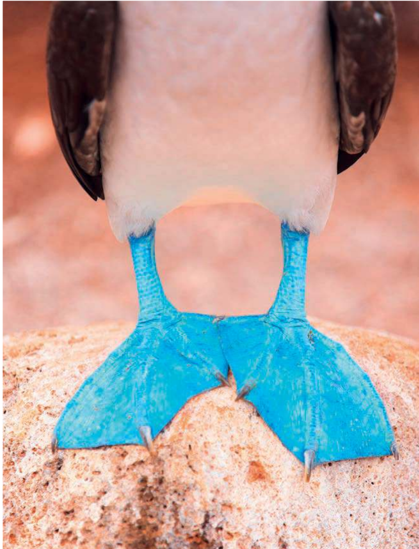
Blaufußtölpel auf den Galápagos-Inseln. Auf dem zu Ecuador gehörenden Archipel hat sich ein isoliertes eigenständiges Ökosystem gebildet

etwa der Pantanal oder die Serra de Canastra, beherbergen eine schillernde Tierwelt mit Ameisenbären, Jaguaren und Kaimanen. Auch die Kultur kommt nicht zu kurz: Der südamerikanische Karneval ist weltberühmt, Argentinien lockt mit Tango, und das unwahrscheinlichste Opernhaus steht in aller Pracht in Manaus mitten im Amazonasgebiet.