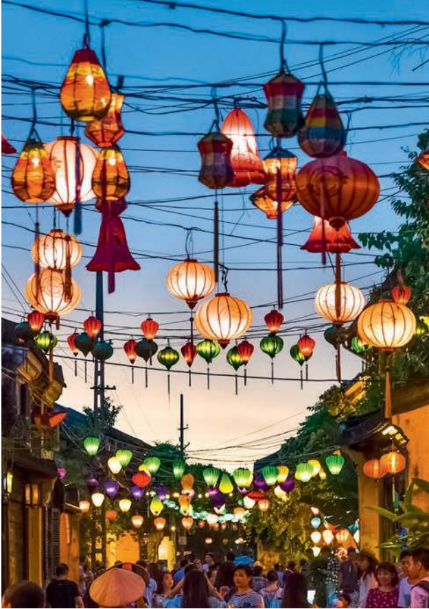
Von Hunderten Laternen erleuchtete Einkaufsstraße in Hoi An in Zentralvietnam