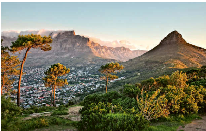
Vom Signal Hill, einem Ausläufer des Tafelberg-Massivs, eröffnen sich fantastische Ausblicke auf die V&A Waterfront, Kapstadts Stadtzentrum und Robben Island.

die unterhalb des Gipfels am Hang steht. Anders als der Tafelberg und Lion's Head ist der Signal Hill bis zum Gipfel mit dem Auto befahrbar. Die schönste Stimmung bietet der Berg zum Sonnenuntergang, wenn sich Einheimische und Besucher der Stadt zum Sundowner hier versammeln. Der obere Berghang ist dann ein wunderschöner Ort für ein Picknick mit Blick auf Robben Island, die Tafelbucht und das Lichtermeer der Stadt. Signal Hill Road, Table Mountain National Park