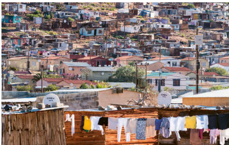
Im »Tal der der Reben und Rosen« leben viele Saisonarbeiter vom Weinbau – sie wohnen in einfachen Hütten außerhalb von Robertson.

fabriken bestimmen Weinabfüllanlagen und Obstmärkte das Bild der Stadt, die als wirtschaftliches Zentrum des Breede Valley fungiert. Besonders schön ist die Gegend im Frühling, wenn sie sich in ein farbenfrohes Blütenmeer verwandelt.