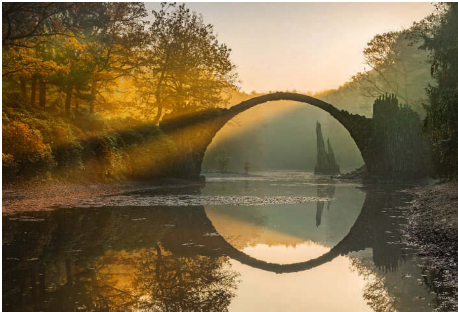
Morgenstimmung an der Rakotzbrücke im Azaleen- und Rhododendronpark Kromlau

Fürst Pücklers ruinöser Traum von gestalteter Natur