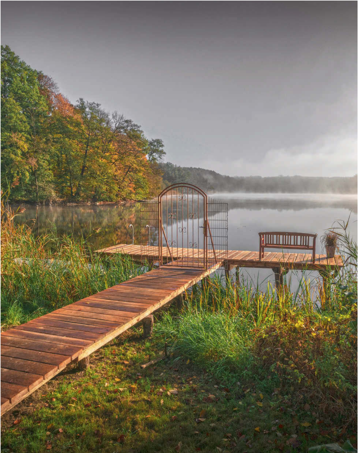
Nur einen Kilometer vom Kloster Chorin entfernt, im Biosphärenreservat Schorfheide-Chorin, liegt der stille Amtssee.