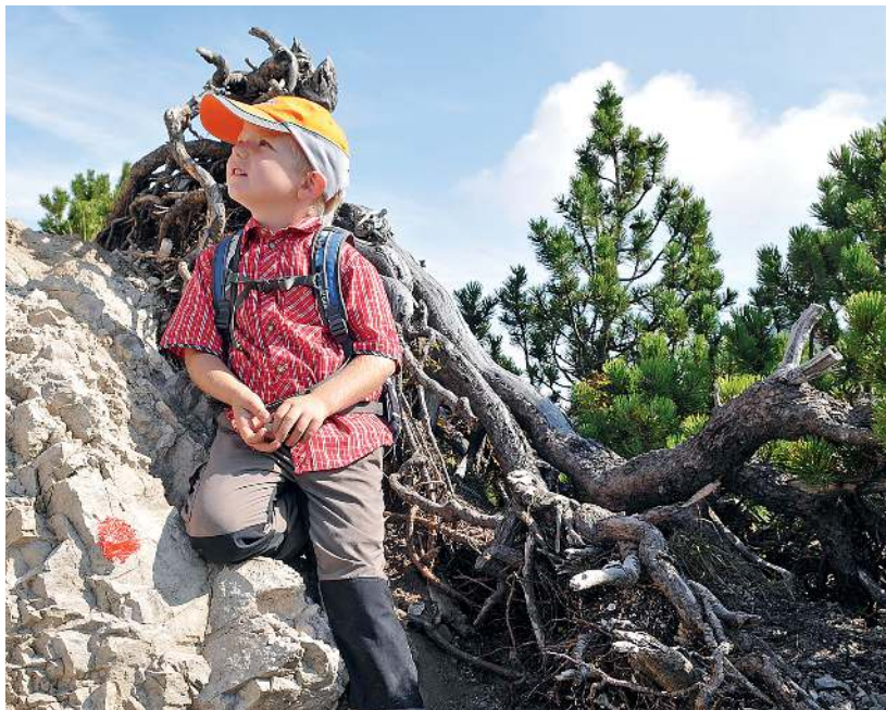
Aufregend: Felsen sorgen für Spannung.

Ein kleiner Gletscher als Kühlmittel für Münchner Bier