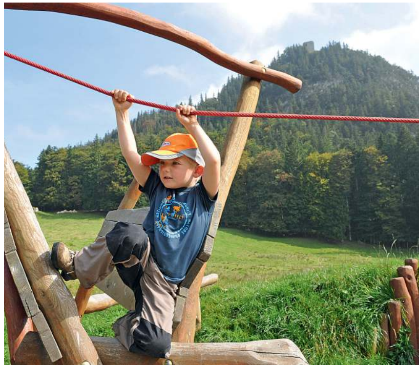
Pause: Spielplatz unter dem Falkenstein (Tour 40).