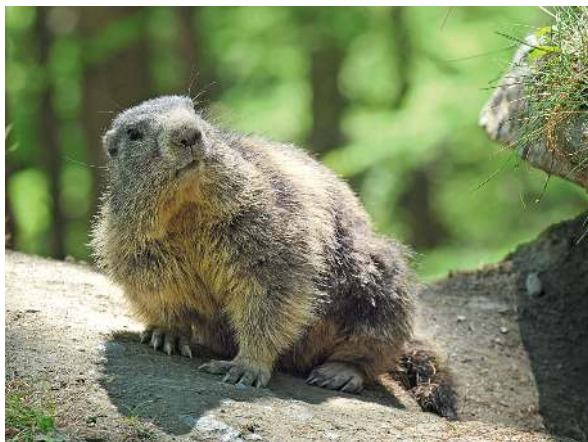
Putzig: Murmeltier vor seinem Bau.