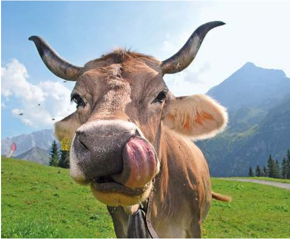
Riesig: Die raue Zunge einer Kuh.