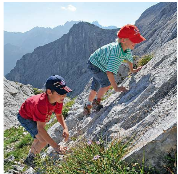
Klettern: Kinder sind Naturtalente im Fels.

Die Tourenkarten können Sie unter www.bassermann-verlag.de/familienwanderungen herunterladen und ausdrucken.