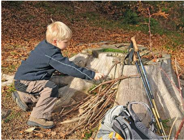
Spielen: Mit Zweigen und Moos lässt sich viel bauen.

Materialien fantasievoll spielen. Denn die merken ganz schnell, dass die Natur viel spannender ist als jegliches Computerspiel. Und so wird aus ein paar Zweigen, Tannenzapfen und Moos ein kleines Dorf gebaut, mutig werden Ameisenhügel oder Löcher unter Wurzeln erkundet – bei denen Eltern idealerweise eine passende, geheimnisvolle Geschichte erzählen – oder aus einem Ast ein Wanderstock geschnitzt. Mutig macht man Bekanntschaft mit Kühen und Schafen, entdeckt Gämsen und Murmeltiere, nähert sich vorsichtig einer Eidechse, die auf einem von der Sonne angewärmten Stein sitzt, oder einem Alpensalamander, der behäbig über den Weg schlendert. Oder teilt sich die Brotzeit mit einer neugierigen Alpendohle, die einem manchmal sogar aus der Hand frisst. Und freut sich über eine Einkehr in einer uralten Alm oder einer Alpenvereinshütte und am Gipfel auf die Brotzeit.