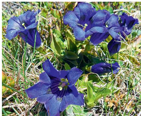
Bunt: Enziane in ihrer ganzen Pracht.

Leichte Grattour zwischen Schliersee und Spitzingsee