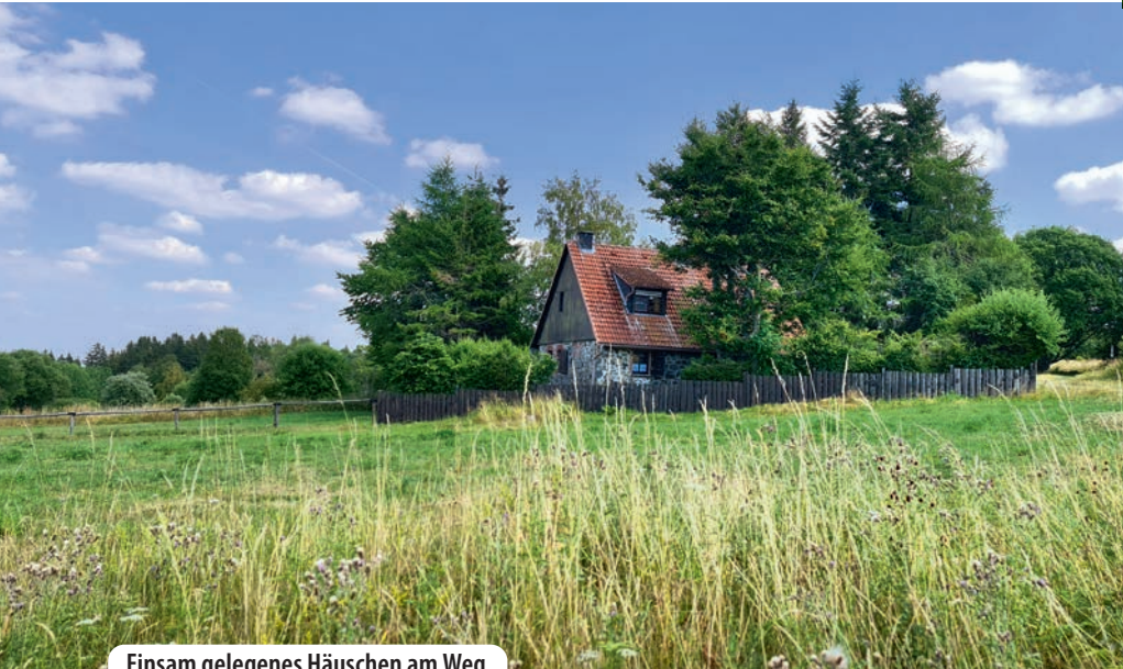
Einsam gelegenes Häuschen am Weg

Den See umrunden wir und nehmen einen kleinen Weg zum etwas höher gelegenen Steinernen Haus . Zwar ist von diesem kaum mehr etwas zu sehen, es gibt aber eine Sage über diesen Ort. So liebten sich einst ein Mädel und ein Bursche, konnten aber nicht zusammen sein, weil ihnen Grund und Boden fehlte. Als der Bursche in die Hohe Rhön zum Arbeiten musste, fluchte