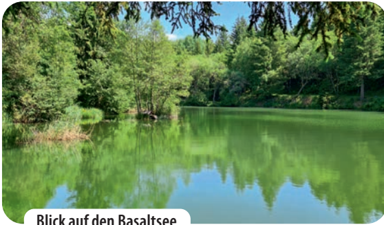
Blick auf den Basaltsee

einem kühlen Getränk. Augenblicke später ploppen unsere Bügelflaschen am wurzigen Uferand des Sees auf. Immer wieder hören wir ein sattes Platschen auf dem Wasser. Achtsam halten wir den Blick auf das Gewässer und plötzlich springt keck eine zappelnde Rhönforelle in die Lüfte und taucht sofort wieder ab.