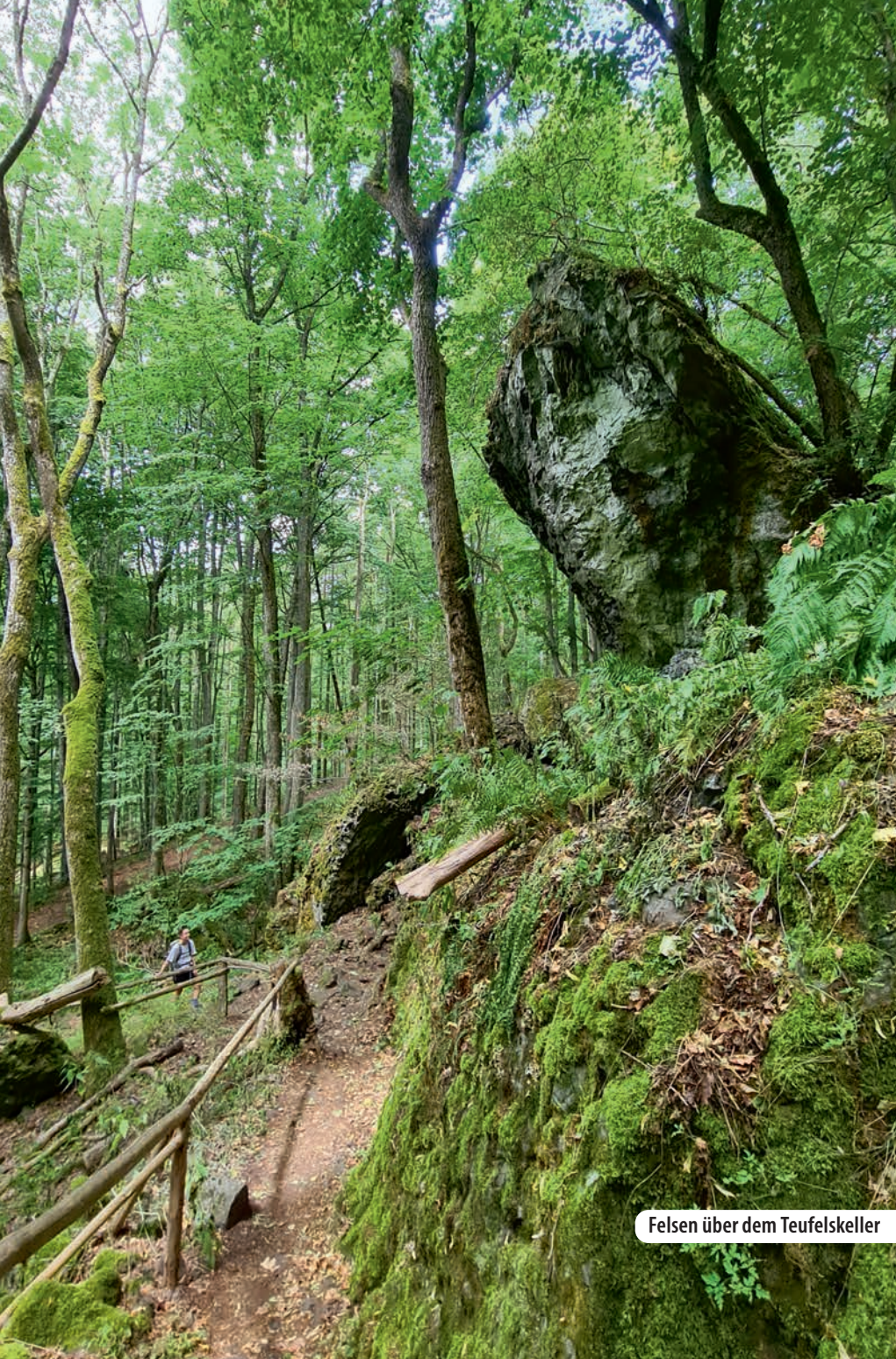
Felsen über dem Teufelskeller