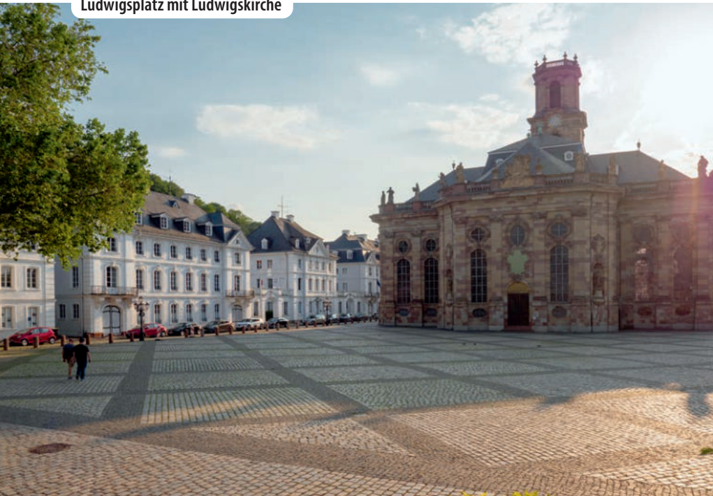
Ludwigsplatz mit Ludwigskirche

Die Völklinger Hütte vereint industrielle Ästhetik mit zeitgenössischer Kunst. Ihre einzigartige Atmosphäre dient als eindrucksvolle Kulisse für vielfältige Kunstausstellungen. Besucher erleben eine faszinierende Symbiose aus Vergänglichkeit und Gegenwart.