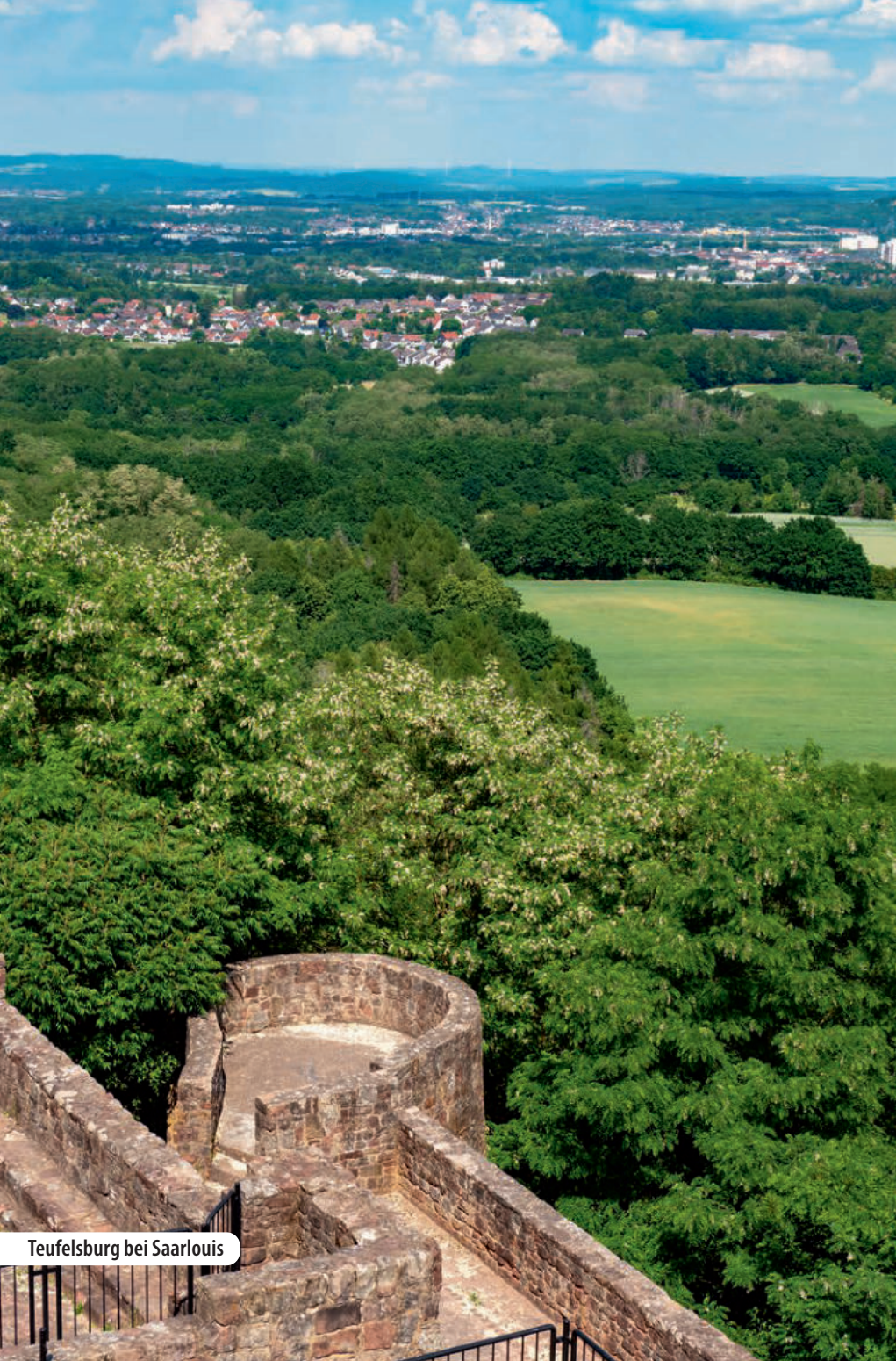
Teufelsburg bei Saarlouis