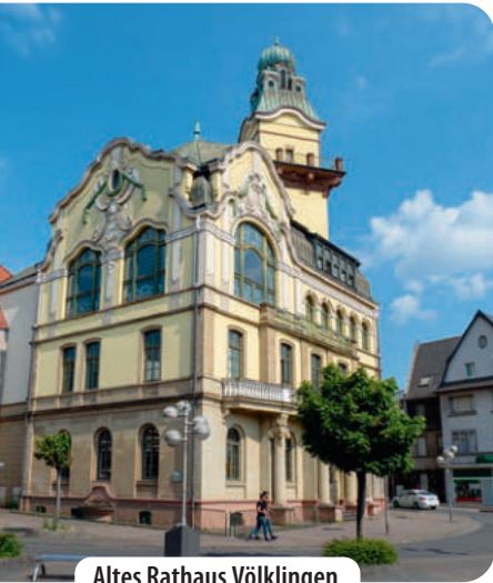
Altes Rathaus Völklingen

Kurz danach am Ende des Parks gabelt sich der Weg. Wir halten uns leicht links und treffen auf den im Karomuster gepflasterten Püttlinger Rathausplatz mit dem mediterranen 6 Restaurant Iliri . Am Ende des Platzes fahren wir in die Marktstraße rechts des Kollerbachs. An der nächsten Abzweigung nach links überqueren wir den Bach und biegen direkt hinter der Brücke