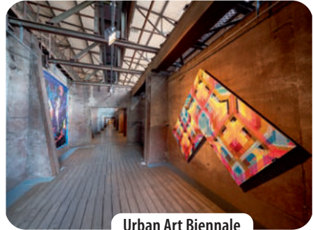
Urban Art Biennale

Wir beginnen unsere Fahrradtour in Völklingen am Parkplatz der Völklinger Hütte , zu dem auch ein kostenloser Wohnmobilstellplatz gehört. An der Zufahrt fahren wir rechts bis zu einem Kreisverkehr, an dem sich der Besuchereingang zum 1 Weltkulturerbe Völklinger Hütte befindet, einem der beeindruckendsten Industrie- und Kulturdenkmäler, dem die UNESCO nicht umsonst den Welterbestatus verliehen hat.