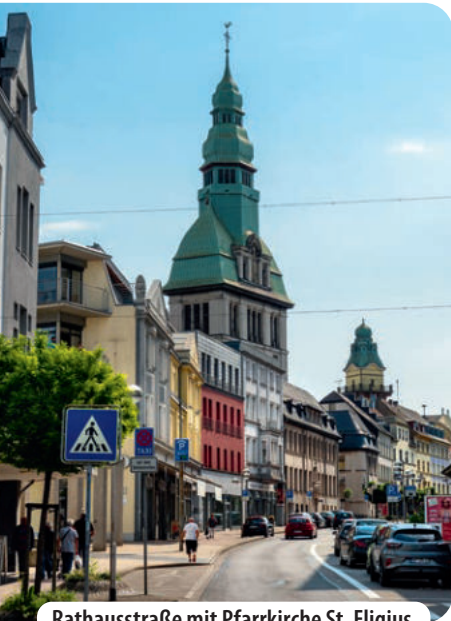
Rathausstraße mit Pfarrkirche St. Eligius

durch den Globus-Baukomplex fahren und kommen danach an einen Kreisverkehr, der von der Brücke der Südtangente überspannt wird. Wen die düstere autogerechte Brachialarchitektur der 1960er- und 70er-Jahre zu sehr gruselt, schiebt das Rad besser auf dem Gehweg. Hinter dem Kreisverkehr geht es geradeaus in die Rathausstraße mit dem markanten Kirchturm, die nun einen wesentlich freundlicheren Anblick bietet. Wir sollten unbedingt einen Blick in die übergroß wirkende 2 Pfarrkirche St. Eligius werfen, die 1912/13 im neobarocken/neoklassizistischen Stil mit Jugendstilelementen erbaut wurde. Am Ende der langen Rathausstraße sehen wir schließlich das namensgebende Gebäude, das 3 Alte Rathaus am neu gestalteten Platz. Das imposante ursprünglich neoklassizistische Gebäude wurde 1905–1907 im Jugendstil erweitert und umgebaut.