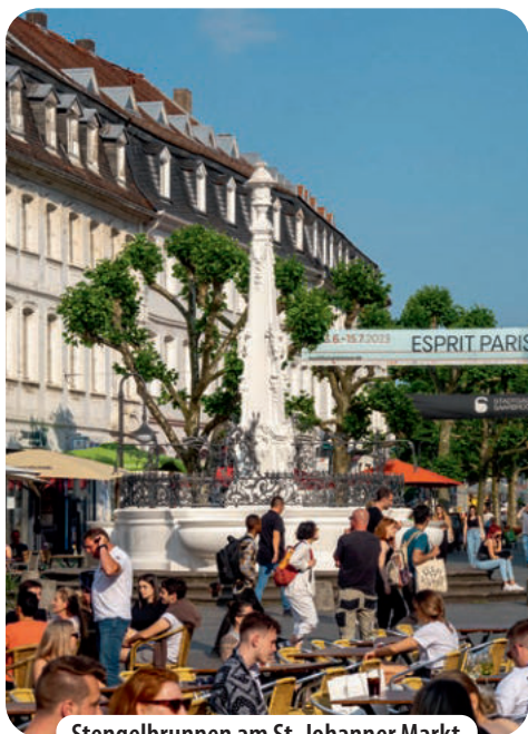
Stengelbrunnen am St. Johanner Markt

ranrücken. Vor der aus Sandstein erbauten historischen Alten Brücke biegen wir links ab Richtung St. Johanner Markt. Dazu kreuzen wir die B 51 und kommen am alt-eingesessenen und trotzdem modernen 11 Gasthaus Zahn vorbei. Kurz danach erreichen wir den zentral in der Altstadt gelegenen 12 St. Johanner Markt mit seinem weißen Barockbrunnen. Ein Lokal reiht sich hier an das andere mit Tischen und Stühlen auf dem Platz. Wir sind hier mittendrin im Ausgehviertel mit unzähligen Cafés und Restaurants in malerischen Gassen. Reichlich Möglichkeiten für eine entspannende Auszeit mit kulinarischen Genüssen. Dazwischen gibt es noch das