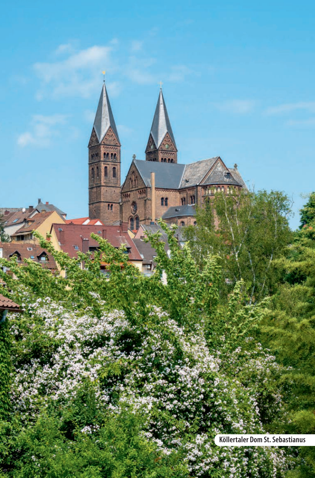
Köllertaler Dom St. Sebastianus