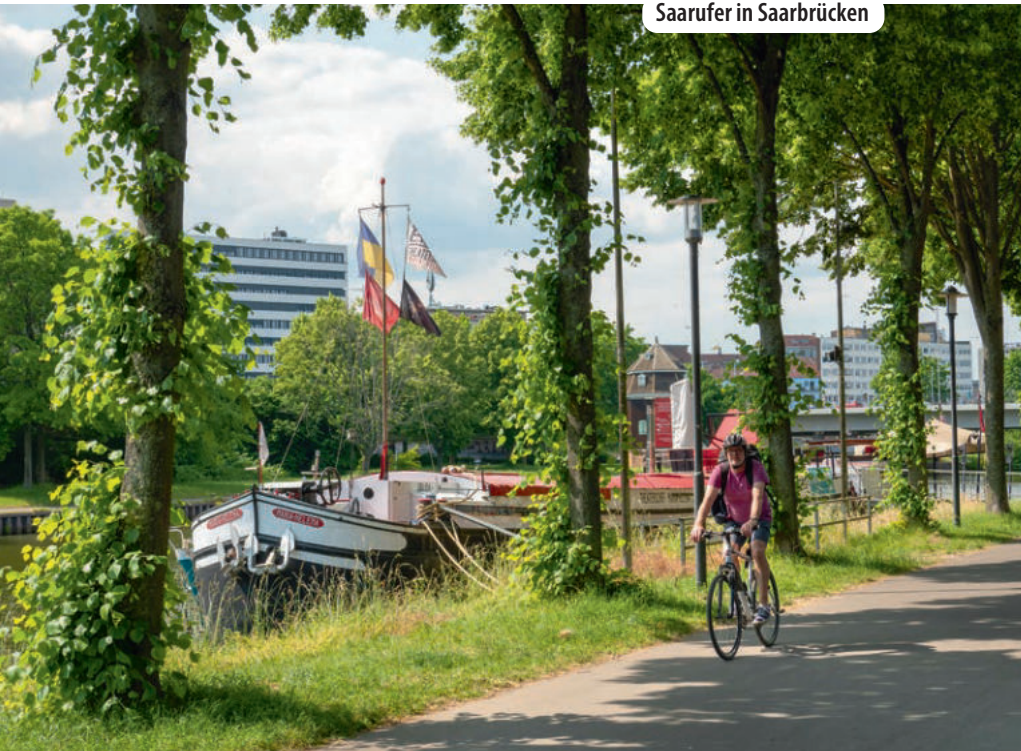
Saarufer in Saarbrücken

Der Bürgerpark entstand auf dem seit dem Krieg brachliegenden Gelände des ehemaligen Kohlehafens. In den 1980ern plante man einen Park, der moderne Elemente mit historischen ausgegrabenen Funden verbindet. Ein Bouleplatz und eine Skateranlage wurden integriert.