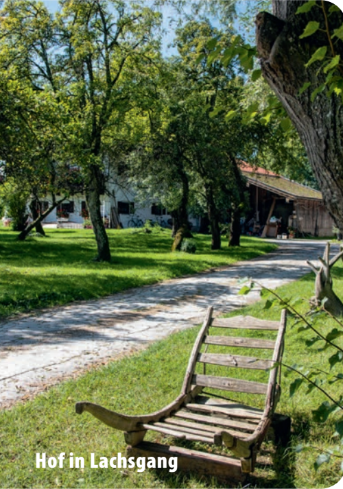
Hof in Lachsgang