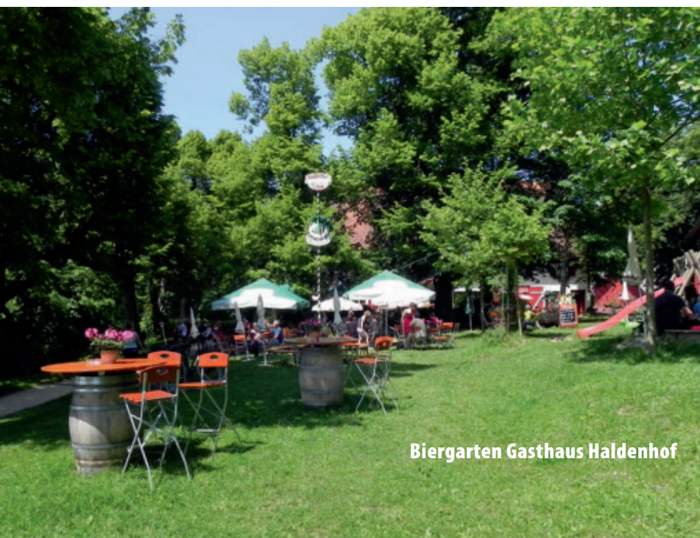
Biergarten Gasthaus Haldenhof