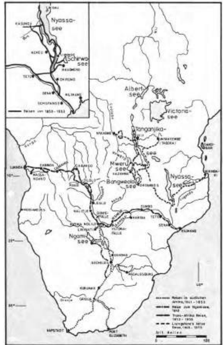
David Livingstones Reisen 1841–1873

Seine Bitte sollte sich nicht erfüllen. Er zog erst einmal an der Ostseite des Tanganjika-Sees südwärts erneut bis zum Bangweolo-See und umwanderte, stets nach den Nilquellen suchend, dessen Osthälfte. Aber die Strapazen dieser letzten Reise waren zu viel für den geschwächten Körper. Am 27. April 1873 vermerkte er ein letztes Mal in seinem Tagebuch: »Völlig erschöpft und bleibe – erholen ...« In der Hütte eines Dorfes machte er Rast.