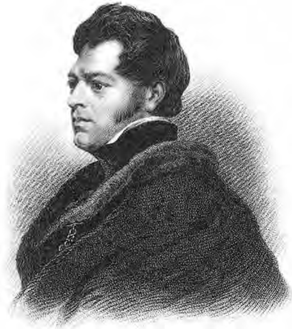
Dr. John Richardson

Ein simpler Schreibstubenplan. Es ging nur darum, von A (dem Hafen York Factory) nach B (der Mündung