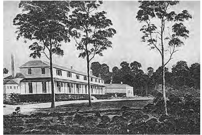
Das Government House in Hobart, Ölgemälde von 1837

Dies alles erreichte am Ende auch den Kolonialminister in London, Lord Stanley, und veranlasste ihn, Franklin unter dem Datum des 13. September 1842 mitzuteilen, dass er Montagu, dem durch eine fadenscheinige Entlassung Unrecht geschehen sei, zur Wiedergutmachung den