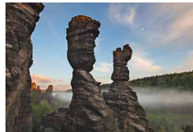
Lor ate non eatur, untor aut raestis esciis volenis doluptat eem audigna tatecto enesciur seq

Linnémuseum: www.linnaeus.se/en Linnégarten: www.botan.uu.se/our-gardens/the-linnaeus-garden Hammarby: www.botan.uu.se/our-gardens/linnaeus-hammarby