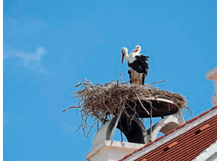
Der Weißstorch gilt als heimliches Wappentier der Stadt Rust.

Eine Rundwanderung in und um Rust sollte also wohl von der malerischen historischen Altstadt zu einem