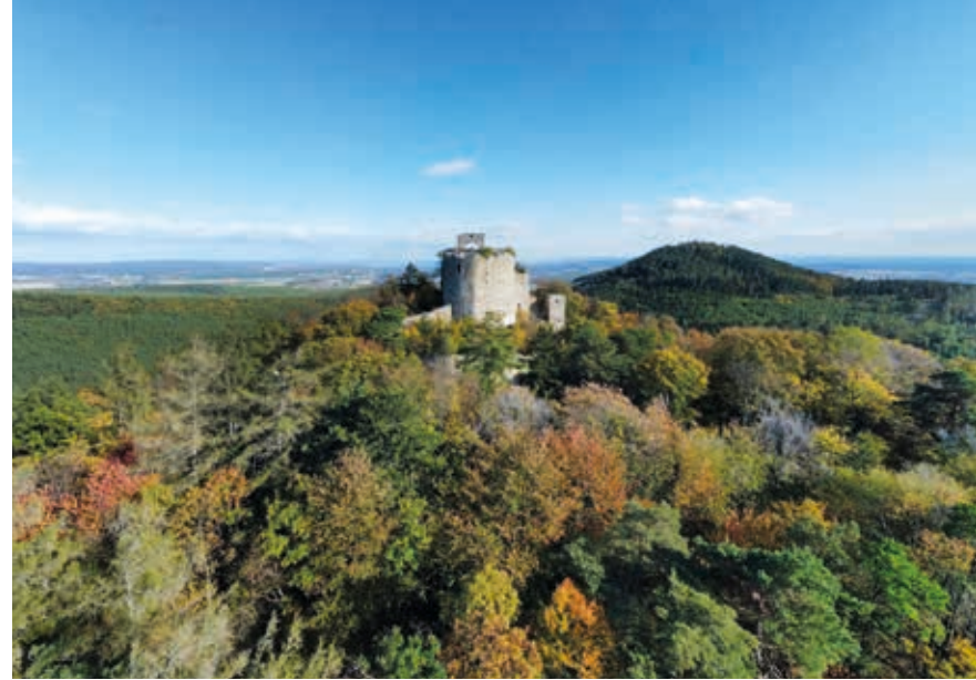
Die Burgruine Landsee zählt zu den größten ihrer Art in Mitteleuropa.

Die Wanderung durch einen Teil des Naturparks starten wir in Kobersdorf an der Kreuzung Hauptstraße/ Kirchengasse/Theodor-Kery-Straße. Hier befinden sich an einem Baum die Wegweiser, die uns mit einer rot-weiß-roten Markierung durch den Naturpark leiten. Wir gehen zunächst über den Judensteig Richtung Ruine Landsee, damit zugleich auf dem Zentralalpenweg 02, dem Ostösterreichischen Grenzlandweg 07 und dem Europäischen Fernwanderweg E4. Über die Theodor-Kery-Straße geht es Richtung Süden, dann nehmen wir nach knapp einem Kilometer halbrechts die Gasse „Am Waldhof“ und biegen etwa 300 Meter danach links über eine Brücke (rot-weiß-rote Markierung am Brückengeländer) in einen Weg ein, der zwischen