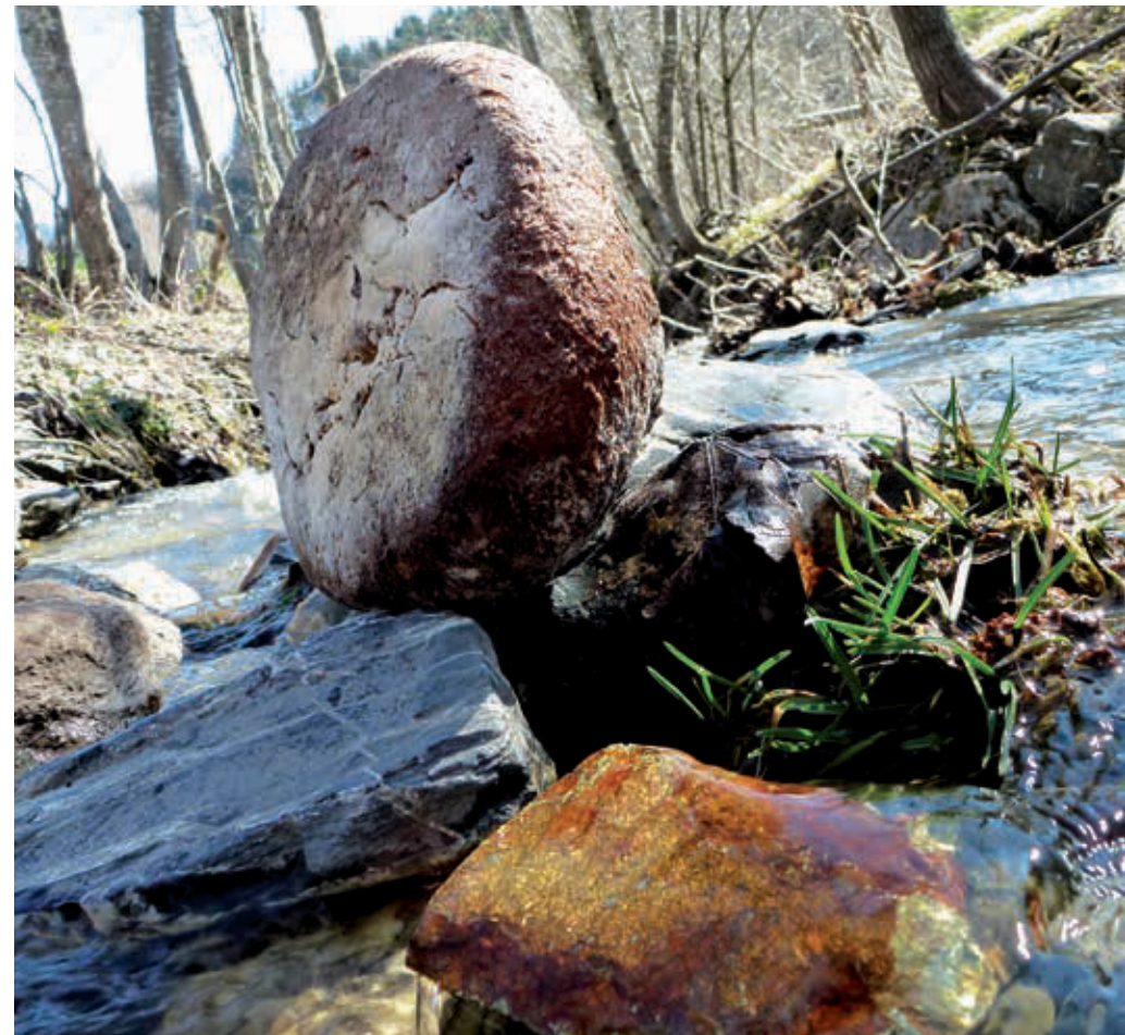
Kupfer und Brot im Bach

habhaft werden konnte, und trug es heim in sein Kirchsteingut. Am nächsten Tag pickelten er und seine Frau mit Knecht und Dirn im Roßbach und stapelten das vermeintliche Gold im Keller des Bauernhauses. Schließlich schickte der Bauer noch seinen Knecht bei Nacht und Nebel nach Dienten, um an einer Kohlstätte des damaligen Eisenbergbaues einen Sack Holzkohle zu stehlen. Anschließend versuchten sie gemeinsam, das Erz im Keller zu schmelzen. Dieser Versuch misslang, doch dabei wäre beinahe der Bauernhof abgebrannt.