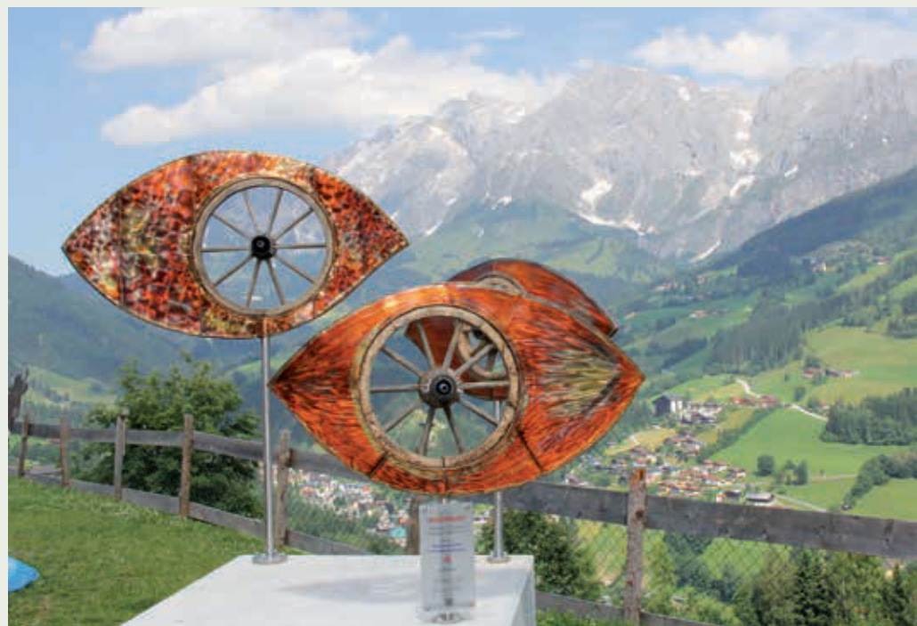
Augenblick, Kunstwerk von Max Sendlhofer

Ein weiterer Weg zur St. Veiter Höhe führt vom Ortsteil Neubau entlang der Paussenberg-Galerie hinauf zur Jausenstation Paussbauer, die eine Einkehr lohnt. Heimische Künstler haben hier große, sehenswerte Skulpturen aus Metall und Holz geschaffen wie „Dynamisches Chaos“ und „Kutscher Tonis Rastplatz“. Auch „Torzumhochkönig“, „Pornorama“ und die „Gams“ sind sehenswerte Kunstobjekte. Die letzte Skulptur vor der Jausenstation Paussbauer nennt sich „Augenblick“ und ist von Max Sendlhofer aus Kupferblech gefertigt. Man kann durch die Mitte der „Augen“ der Skulptur direkt zu den Stolleneingängen von Mühlbach schauen. Familie Ammerer von der Jausenstation ist hier bekannt für heimische Schmankerl