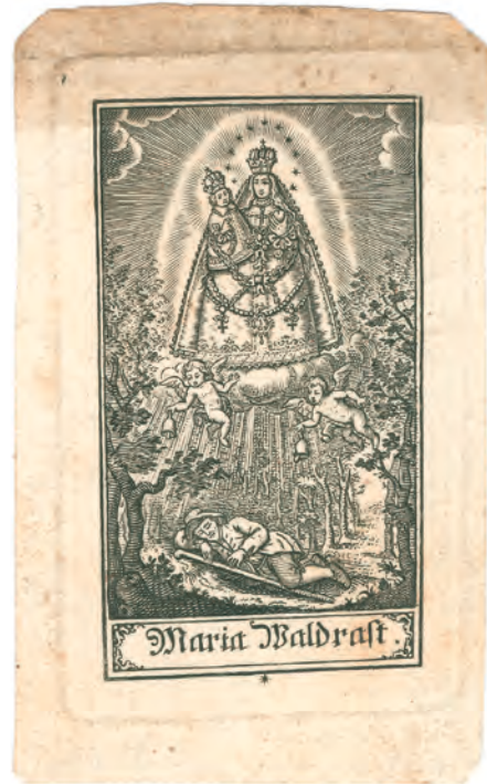
Abb. 5: Szene aus der alten Ursprungslegende: Marienerscheinung, die Glöckchen wecken den im Moos schlafenden Christian Lusch.

Als Anfang des 17. Jahrhunderts bei Foy in Belgien in einem Baumstamm eine Marienstatue gefunden worden war, verbreitete sich die Nachricht schnell. In Ver-