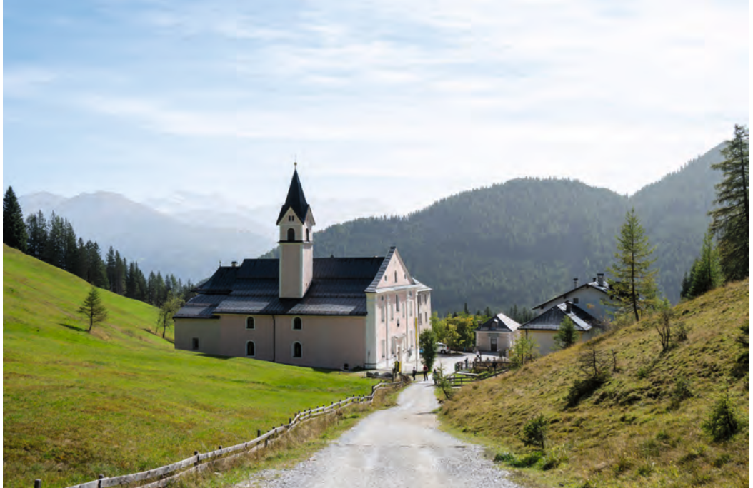
Abb. 2: Kloster und Kirche am Übergang vom Wipptal ins Stubaital

Ein Bezug der Kapelle auf der Waldrast zum weltlichen Recht zeigt sich auch darin, dass ein Opferstock, dessen Inhalt zur Hälfte für den Andachtsort bestimmt war, in Matrei auf der „Urtl“ (Gerichtsstätte) stand. Die „Urtl“ oder „Urtail“ befand sich am Nordende des Marktes Matrei an der Landstraße, dort, wo auch heute noch der von der Waldrast kommende Bach diese Straße kreuzt und der Weg auf die Waldrast abzweigt. 8