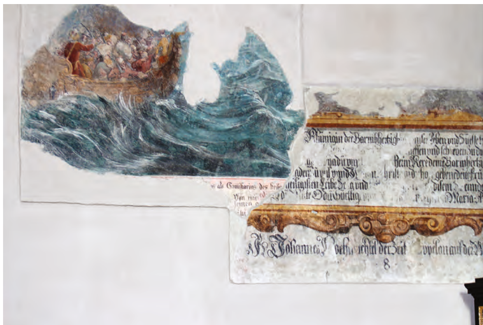
Abb. 4: Nordostwand der Kirche, Wandgemälde mit Inschrift