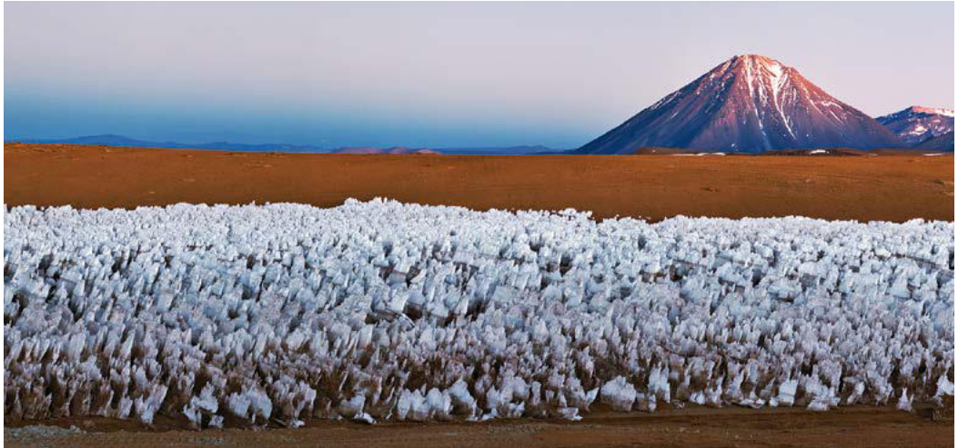
Dieses beeindruckende Panoramabild zeigt die Chajnantor-Hochebene mit dem majestätischen Vulkan Licancabur im Hintergrund.

Die Strahlung aus den kosmischen Gaswolken kann man auf der Erde messen. In den letzten 40 Jahren wurden weltweit Radioteleskope errichtet, um das Verhalten solcher Moleküle im Weltall zu beobachten. In 2550 Metern Höhe steht auf dem Plateau de Bure in den französischen Alpen das größte Interferometer der Nordhalbkugel. Elf silberne 15-Meter-Antennenschüsseln des IRAM-NOEMA-Teleskops glitzern dort auf dem schneebedeckten Bergrücken. Die weltweit größte Anlage dieser Art ist das Atacama Large Millimeter Array (ALMA) in Chile. Es besteht aus 66 Schüsseln, deren Durchmesser zu meist zwölf Meter beträgt. Von Europäern, Amerikanern und Japanern gemeinsam betrieben, liegt das Teleskop 5000 Meter hoch in der extrem dünnen und trockenen Luft, weil die kleinen Radiowellen von der feuchten Atmosphäre in tieferen Lagen ansonsten zu stark absorbiert würden. Es sind genau solche Radioteleskope, die auch für die Abbildung Schwarzer Löcher die entscheidende Rolle spielen werden.