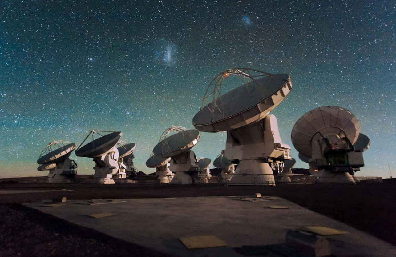
Die Antennen des Atacama Large Millimeter/submillimeter Array (ALMA) auf der Chajnantor-Hochebene in den chilenischen Anden

lich entgegen, fast ein wenig kitschig wirkt er. Sein innerster Kern bleibt dem menschlichen Auge verborgen, weil der Staub jedes optische Licht, das aus seinem Inneren kommt, verschluckt. Nur mit langen Wellenlängen durchdringen Astronomen diese Staubbarriere und erhalten eine Vorstellung vom Zentrum solcher Wolken. Die Infrarot-Wärmestrahlung des heißen Gases beispielsweise dringt ziemlich ungehindert nach außen, genauso wie Radiostrahlung. Wie Röntgenstrahlen den menschlichen Körper durchleuchten, so können diese Strahlen Molekülwolken durchdringen.