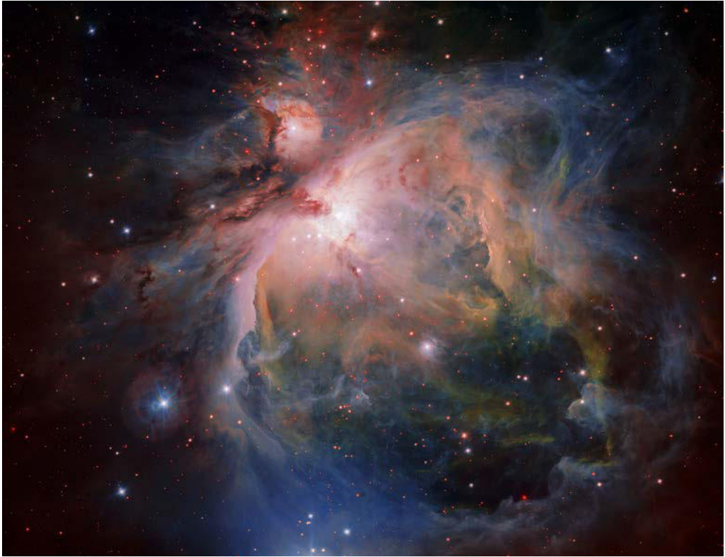
Der spektakuläre Orionnebel und der dazugehörige Haufen junger Sterne im Detail

Mit mächtigen Spiralarmen schiebt unsere Galaxie sie zusammen wie Schneepflüge den Neuschnee. Erblickt man diese Formationen durch das Teleskop, enthüllen sich diese phantastischen kosmischen Kunstwerke des Universums.