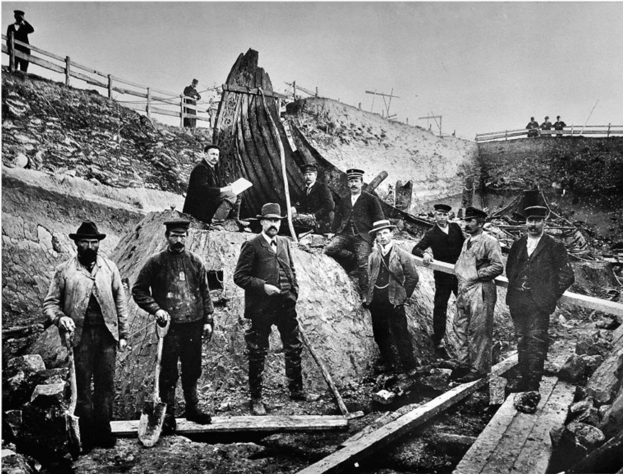
Ausgrabung des Osebergsschiffs, 1904.

sich ebenfalls keine wertvollen Funde aus Edelmetall – diese waren vermutlich bei einer erneuten Öffnung des Grabs etwa ein Jahrhundert nach der Bestattung entnommen worden –, aber das Grab enthielt für die Wissenschaft unschätzbar wichtige Funde vor allem aus Holz, die tiefe Einsichten in die Handwerkstechniken und besonders die Holzverarbeitung der Wikinger ermöglichen. Die auf das Jahr 834 datierbare Bestattung der beiden Frauen gibt bis heute Rätsel auf. Eine der beiden hatte mit etwa 70 bis 80 Jahren ein hohes Alter erreicht, ihre Knochen künden von einer Reihe altersbedingter Gebrechen. Die zweite Frau war neuen Untersuchungen an ihren Skelettresten zufolge mit 50 bis 55 Jahren verstorben. Aufgrund eines bei der ersten Untersuchung diagnostizierten Bruchs an einem Schlüsselbein wurde diese jüngere Frau früher oft als Menschenopfer interpretiert. Inzwischen gilt jedoch nicht mehr als sicher, für welche der beiden Frauen das Grab angelegt