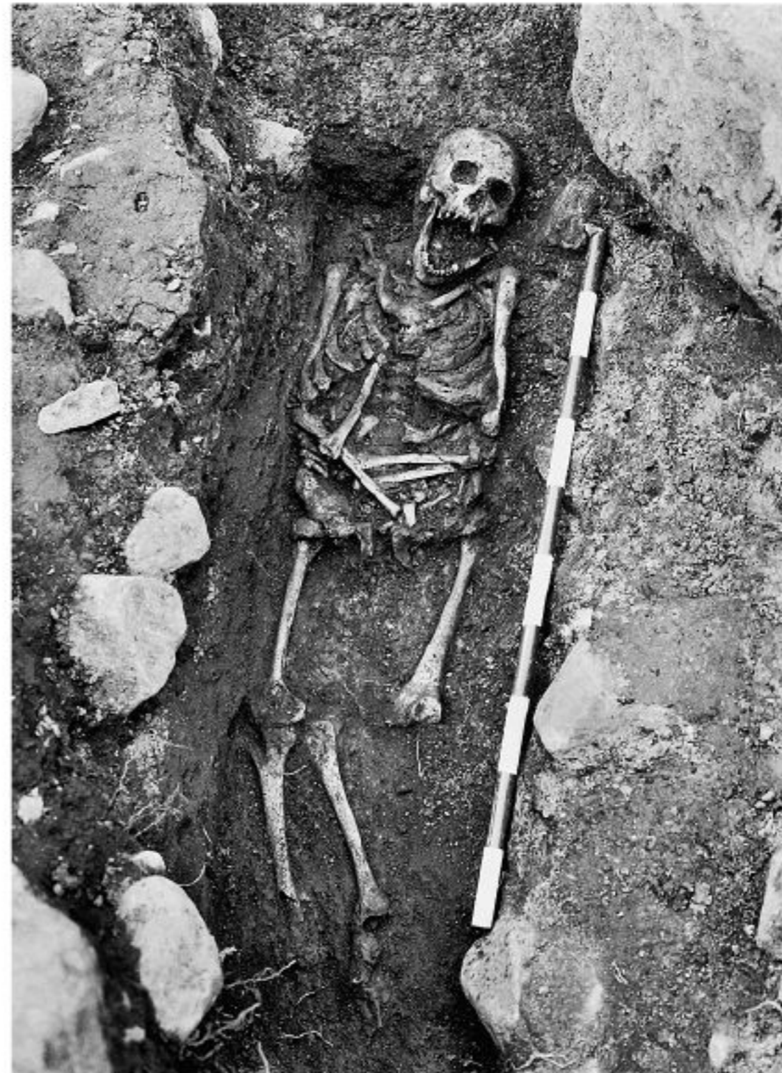
Kleinwüchsiger auf dem Gräberfeld von Tierp.

Ein weiteres Indiz dafür, dass die Gesellschaft der Wikinger sich um die Jüngsten und Ältesten, um kranke und behinderte Mitglieder kümmerte, sind die drei Kleinwüchsigen aus zwei Gräberfeldern der Wikingerzeit im heutigen Schweden. Sie wurden krank geboren. In zwei Fällen handelt es sich um Spondyloepiphysäre Dysplasie. Das ist eine erblich bedingte Erkrankung, die das Knochenwachstum beeinträchtigt. Sie führt zu Kleinwuchs, Missbildungen und Verformungen der Wirbelsäule und Gelenke. Zudem kann sie die Lunge, Augen und Zähne beeinträchtigen, zuweilen auch das Gehör. Die Krankheit wird autosomal-dominant vererbt. Leidet also ein Elternteil an der Erkrankung, sind auch 50 Prozent der Kinder betroffen. Bemerkenswert ist, dass zwei der Kleinwüchsigen auf demselben