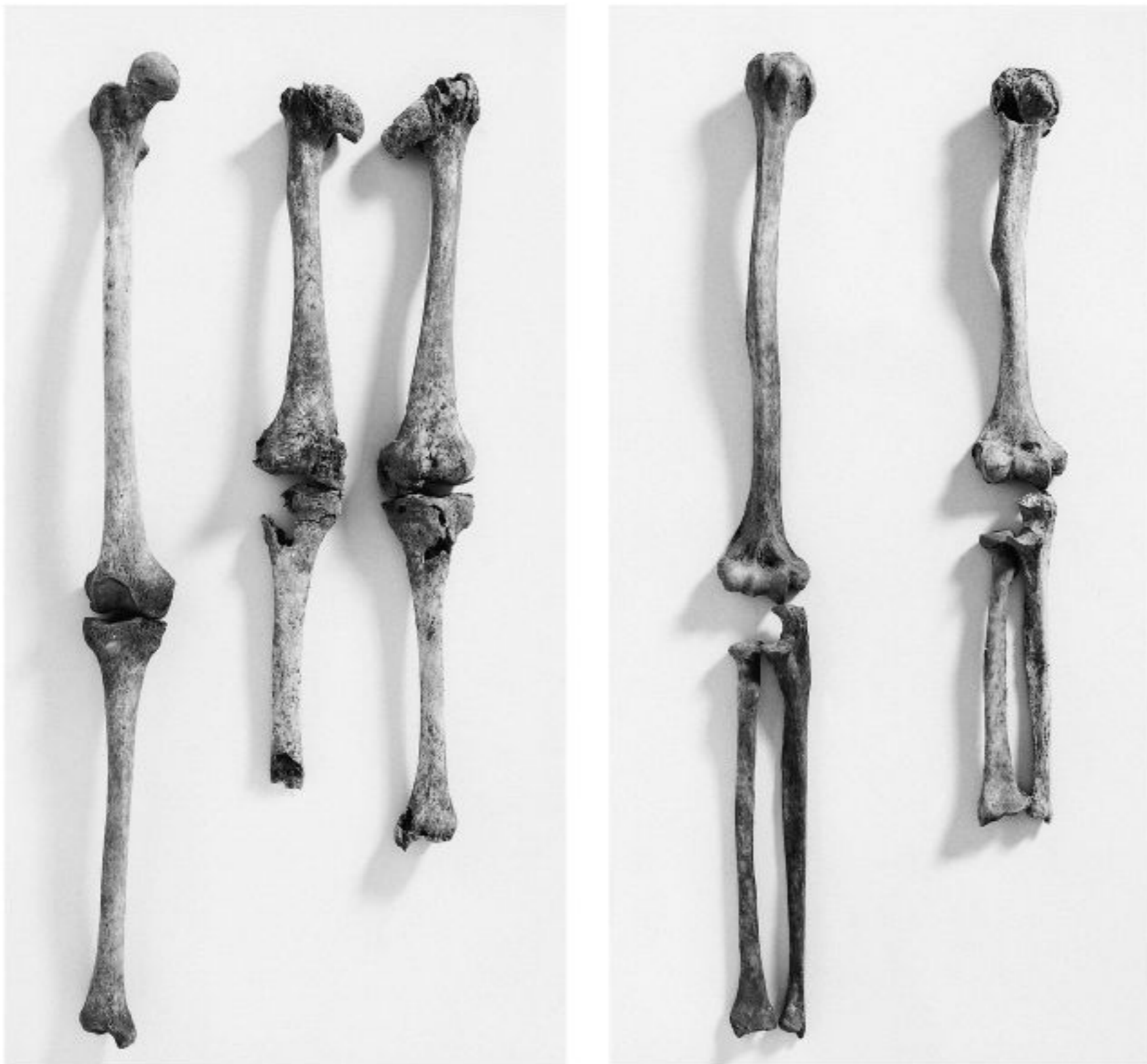
Arme und Beine des Kleinwüchsigen waren deutlich kürzer als normal und die Hüftgelenke verformt.

Gräberfeld geborgen wurden und sehr wahrscheinlich verwandt waren. Der dritte Kleinwüchsige war auf einem anderen Gräberfeld bestattet und wurde ebenfalls mit der Erkrankung geboren, allerdings mit einer anderen Form der Dysplasie. Die Eltern und andere Verwandte oder Freunde müssen das Leiden schon bei der Geburt festgestellt haben. Auf jeden Fall benötigten die drei kleinwüchsigen Neugeborenen mehr Zuwendung als andere Säuglinge und wurden dennoch nicht getötet. Darüber hinaus waren sie als Erwachsene durch die deformierten Gelenke behindert. Trotzdem führten sie ein langes Leben und wurden 50 oder 60 Jahre alt – also älter als manch anderer.