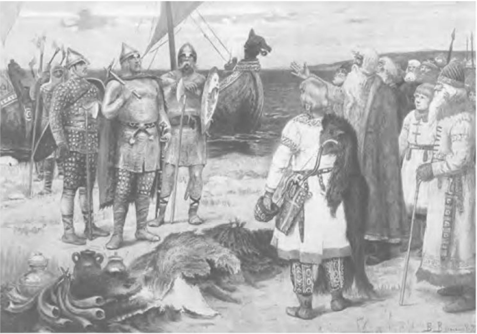
Wiktor Wasnezow: Die Ankunft Rjuriks am Ladogasee (1909)

Wiktor Wasnezows Darstellung von Fürst Rjuriks Ankunft an den Ufern des Ladogasees ist ein Klassiker ganz eigener Art. Die Nestorchronik aus dem zwölften Jahrhundert, die beste Einzelquelle zu dieser Zeit, erwähnt Scharmützel, in denen verstreute slawische Stämme im späteren Russland gegen die »Waräger« – ihr Name für skandinavische Wikinger – gekämpft haben, um sie aus ihrem Land zu vertreiben. Doch als die Tschuden und Merja, die Radimitschen und Kriwitschen und all die anderen Clans und Stämme versuchten, sich selbst zu regieren, kamen dabei nur neue Kriege heraus. Da sie sich weder über Rangordnung und Protokoll noch über Territorien und Regionen einig wurden, wandten sie sich erneut an die Waräger und erbaten von ihnen einen Fürsten: »Unser Land ist groß und reich, doch gibt es darin keine Ordnung. Kommt und herrscht über uns.«