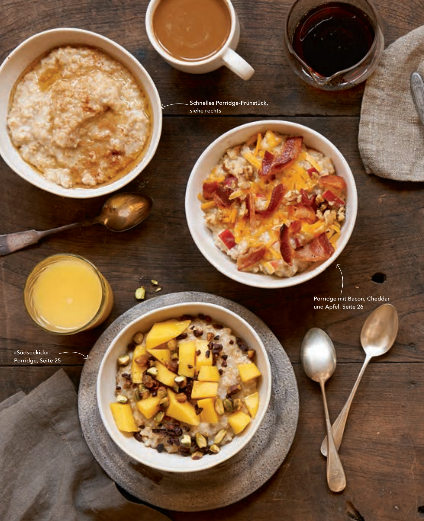
Schnelles Porridge-Frühstück, siehe rechts