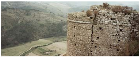
Der legendäre Wachturm von Grotti, auf dem Fetwanska III. (»Die Stämmige Prinzessin«) Ausschau gehalten haben soll – daher der massive Riß.