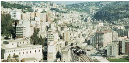
Molvaniens Hauptstadt Lutetia – wo sich alteuropäischer Charme und Beton vereinen.