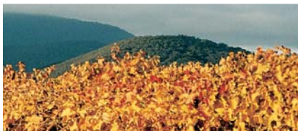
Herbstliches Weinlaub bei Chateau Sultana in der westlichen Weinregion.