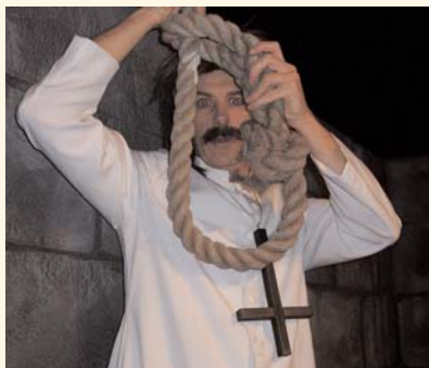
»Ich bin der Antipapst« (2005)

Den schmuseweißen Eisbär muß das bestimmt verdrießen, und eure Kinder können bald nicht mehr auf ihn schießen.