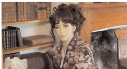
Das kürzlich in Svetranj eröffnete Kabinett von Madame Tussaud zeigt lebensechte Figuren von Nationalhelden, hergestellt aus Ohrenschmalz.