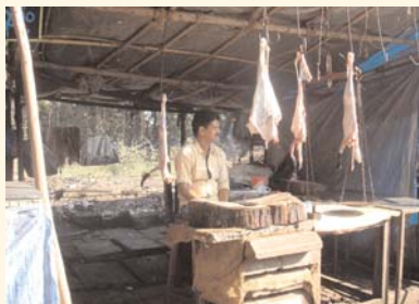
Viele Stände am Straßenrand bieten kleinere chirurgische Eingriffe an.

Fortschritte gibt es auch bei Einrichtungen für Behinderte. Besucher mit Beeinträchtigungen müssen keine bunten Armbänder mehr tragen; in mehreren Hotels gibt es inzwischen Rollstuhlrampen (für die Benutzung wird ein fünfzehnprozentiger Behindertenzuschlag verlangt).