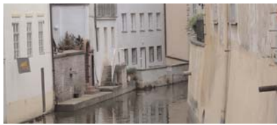
Die Stadt Crepzepe, bekannt als das Venedig Molwaniens, wurde über einem komplizierten System offener Abwasserkanäle gebaut.