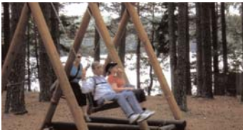
Ost-Euro-Diznee-World bei Sjerezolockt jedes Jahr über 70 Touristen an.