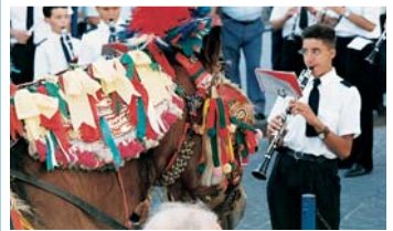
Das farbenfrohe Frühlingsfest in der Östlichen Steppe, wo jedes Jahr halbwüchsige Jungen eine Maultierserenade aufführen.