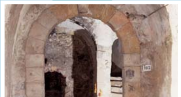
Die berühmten Katakomben von Katkflap – heute eine beliebte Weinbar.