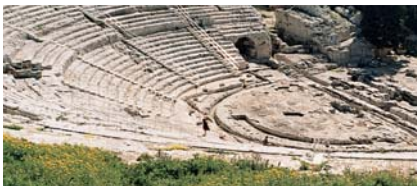
Die »Römischen Ruinen« – das Amphitheater von Slakoff (baugleich mit dem von Licij), errichtet von einer Baufirma aus Rom, die 1978 vor der Fertigstellung Insolvenz anmeldete.