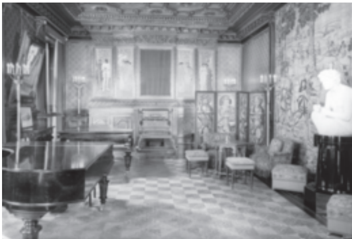
Das Herz des Palais Wittgenstein: der Musiksalon.