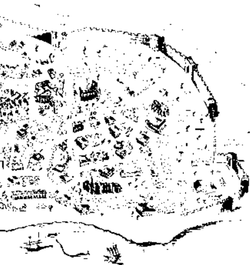
Legende der Stadtkarte im Anhang