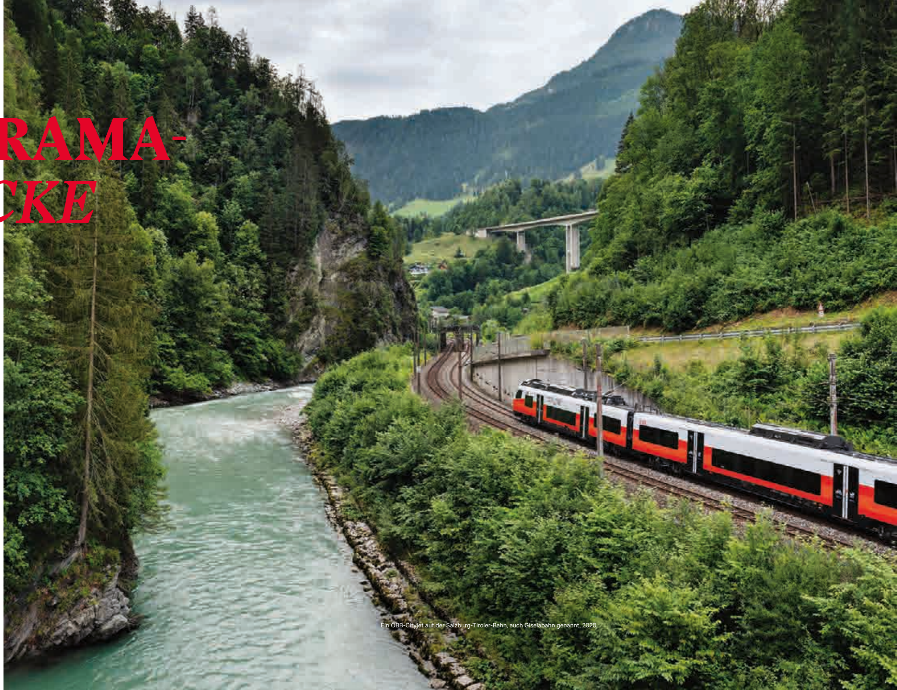
Ein ÖBB-Cityjet auf der Salzburg-Tiroler-Bahn, auch Giselabahn genannt, 2020.

Sie ist Teil unseres Lebens und der Kulturlandschaft. Und das seit über hundert Jahren. Eine fotografische Reise übers Land – mitten hinein in den Lebensraum Bahn.