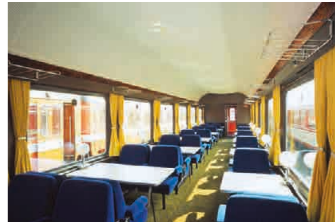
Das neue Bahnfahren in der Werbung: Komfort, Luxus und eine gewisse Eleganz, um 1980.