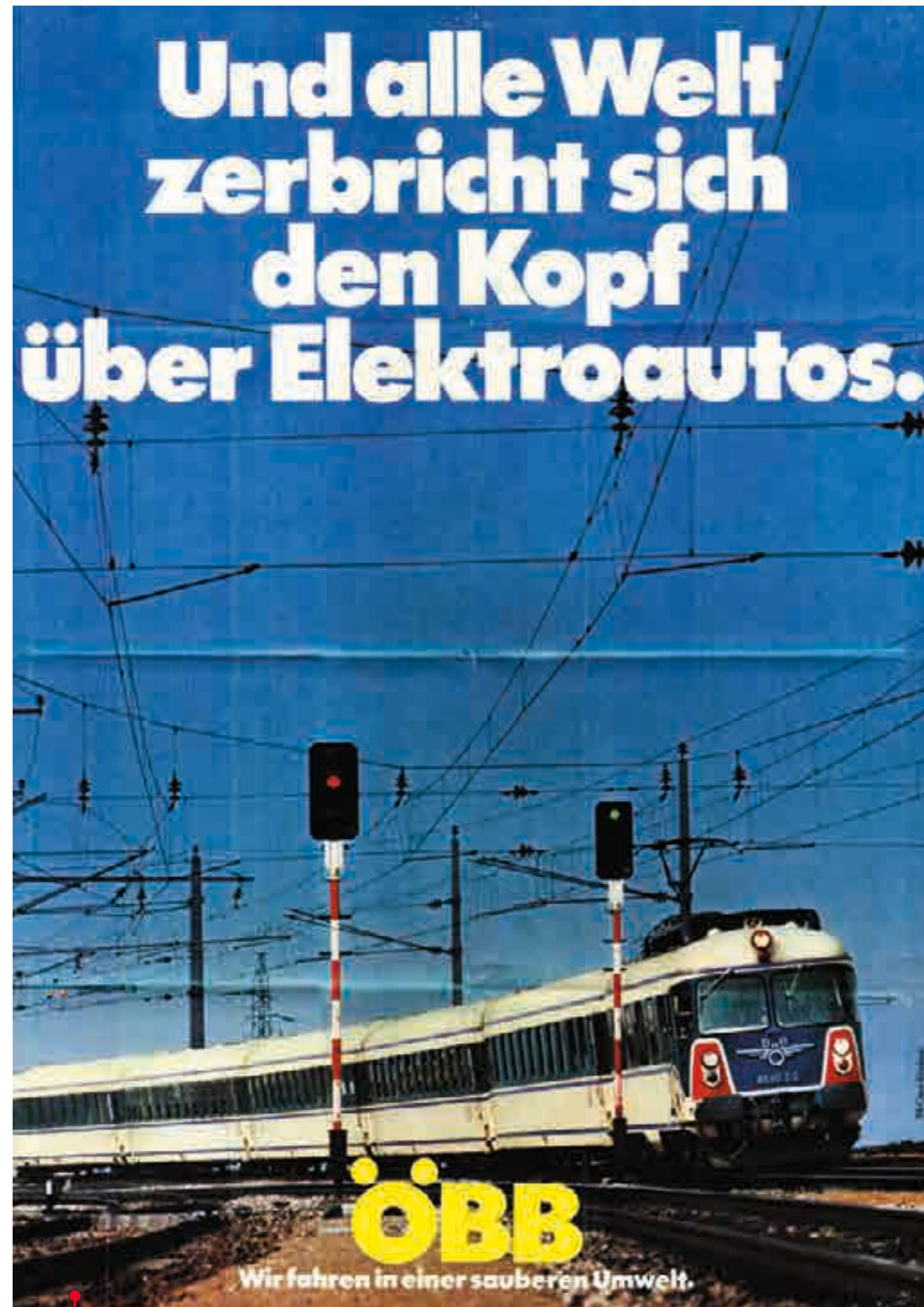
Elektromobilität auf Schiene: Umweltschutz ist bei der Bahn bereits Mitte der 1970er ein wichtiges Thema.