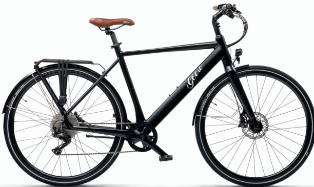
Abb. 1:

Mittels einer Anfahrhilfe (als Dreh- oder Druckknopf) kann rasch eine Geschwindigkeit von ca. 6 km/h erreicht werden. Damit fällt das Losfahren leichter!