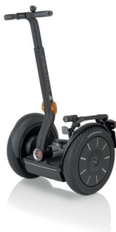
Abb. 2: Segway

Bei Elektrorädern mit einer Leistung von über 600 Watt bzw. einer Bauartgeschwindigkeit von mehr als 25 km/h handelt es sich zumeist um Motorfahrräder (siehe Seite 14). Auch die schnellen Pedelecs ( S-Pedelecs ) gelten als Mopeds. Dies bedeutet, dass jedenfalls Führerschein und Versicherung notwendig sind sowie ein Motorrad-Sturzhelm getragen werden muss!