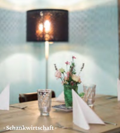
· Schankwirtschaft ·