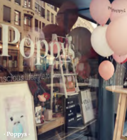
· Poppys ·