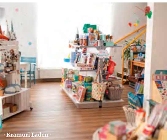
· Kramuri Laden ·