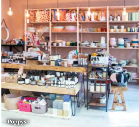
· Poppys ·