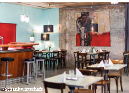
· Schankwirtschaft ·