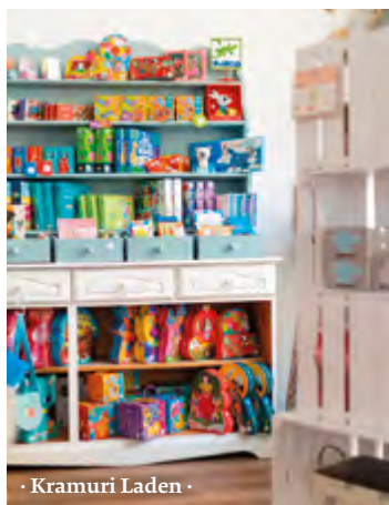
· Kramuri Laden ·