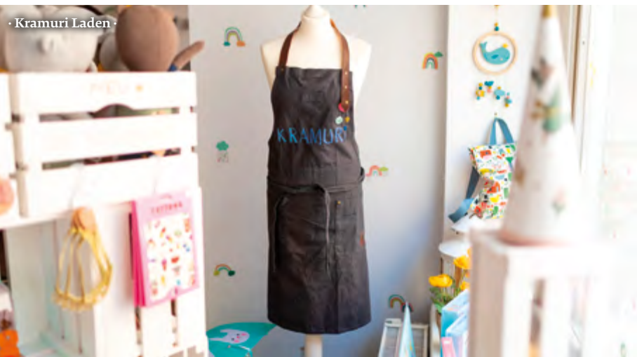
· Kramuri Laden ·