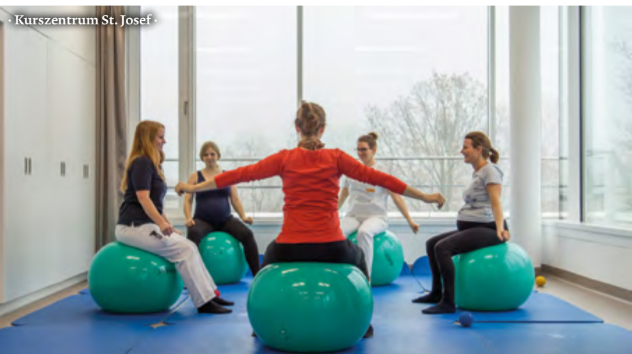
· Kurszentrum St. Josef ·