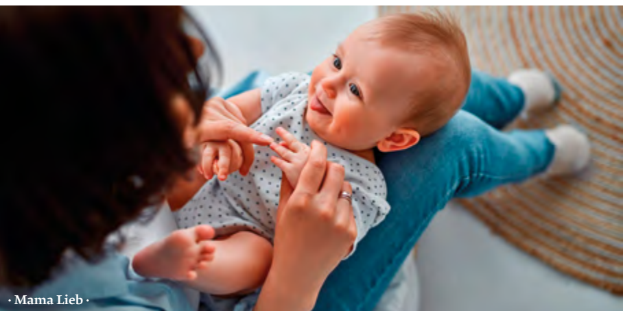
· Mama Lieb ·