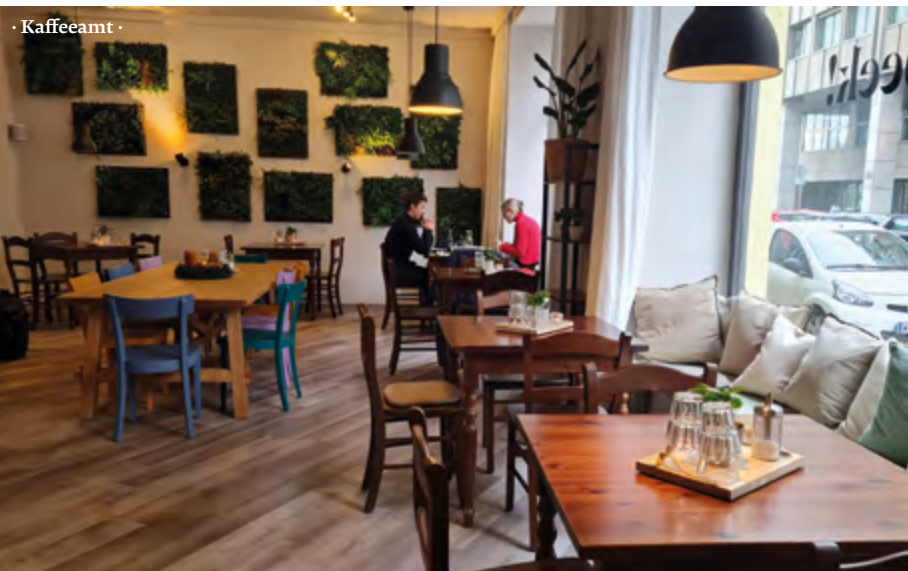
· Kaffeeamt ·