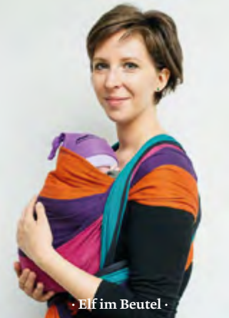
· Elf im Beutel ·