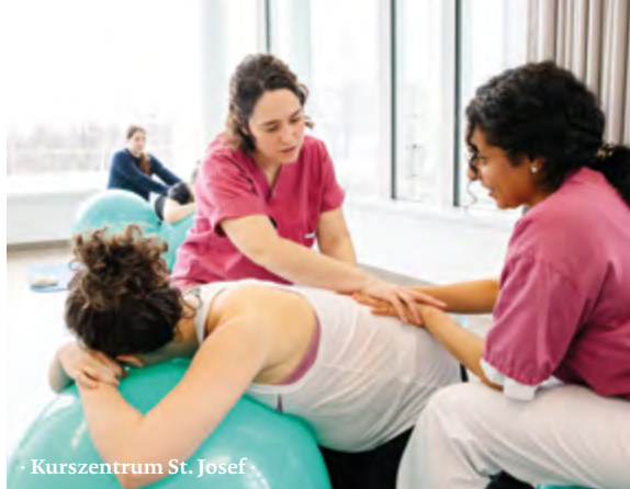
· Kurszentrum St. Josef ·